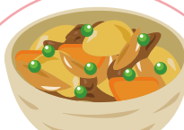
えびと彩り野菜の 煮物盛り合わせ