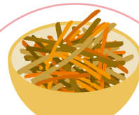
根菜としらたきの きんぴら風