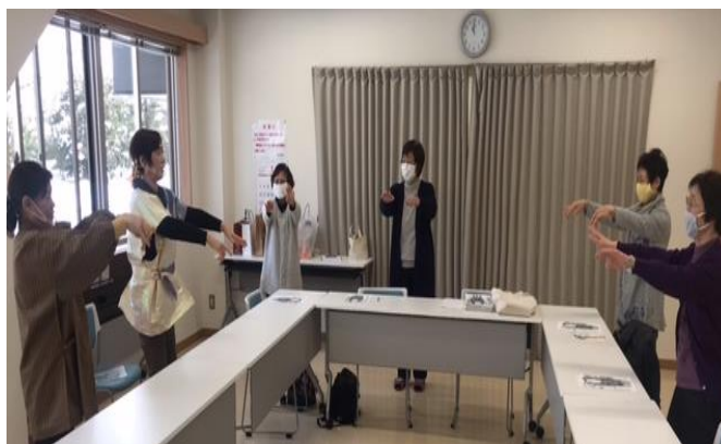
アマビエダンスの様子