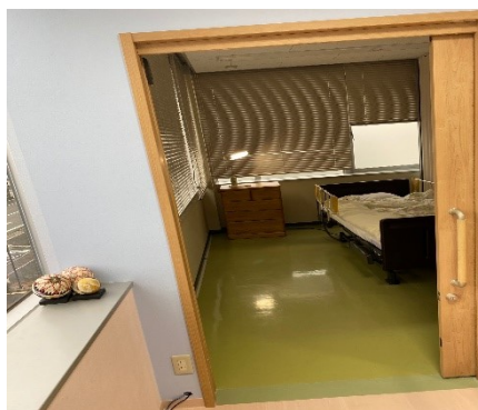
ケアマネの職場が利用者用個室に変わりました。