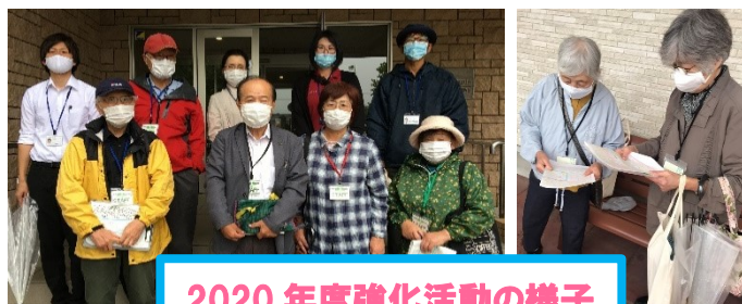
2020年度強化活動の様子

石山総支部は今年も強化月間を石山関連事業所、地域活動部と協力して取り組んでいきます!