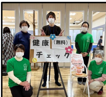
当日は多くの方に来場いただき、楽しく活動しました♪

参加者からは「石山診療所でも、またやりたいね!」とお声があがっていました!来年度石山診療所まつりを開催できるよう、総支部で話し合いを行っていきます♪