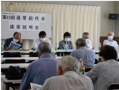
総代会議案説明会