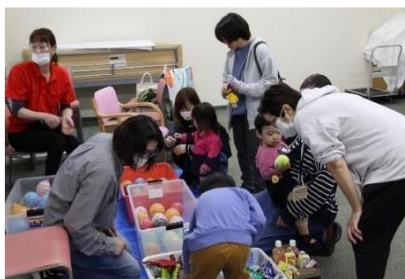
4年ぶりに開催された石山診療所まつり