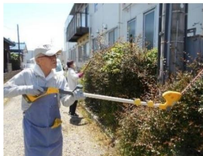
組合員と職員で診療所まわりの草刈りを行いました