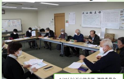
3/19(火) 石山総支部 運営委員会