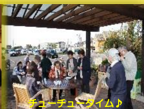
チューチュータイム♪

10月31日(木)「五頭今板温泉 湯本館」に行ってきました。当日は秋晴れの旅行日和となり楽しい時間を過ごすことができました。