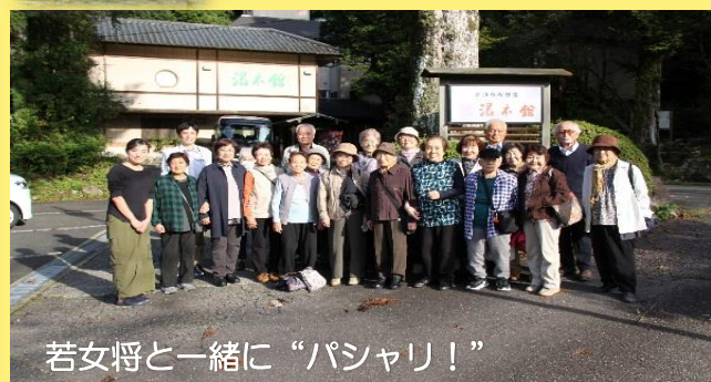
若女将と一緒に“パシャリ!”