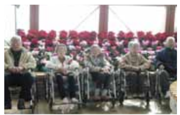
▲ショートステイでは新潟市「いくとびあ」へお出かけ

た。色づき始めた木々を眺め、中田、立木、鳥追の三観音を巡り、美味しいおそばに舌鼓と楽しい旅行になりました。今回は10名程での旅行でしたが、これからもこのような機会を作り多くの方に楽しんでいただけるような催しを企画していきたいと思っております。 ショートステイでも初めてのお出かけレクを楽しみました。新潟市のいくとびあを訪れ、その後お店での昼食を楽しみました。利用者さんの普段はみられない良い表情を見ることができたことは、利用者さんだけでなく同行したスタッフにとっても楽しい行事となりました。これまで、ショートステイではお出かけすることができずにいたので、これを機に今後もお出かけを計画していきたいと思っております。