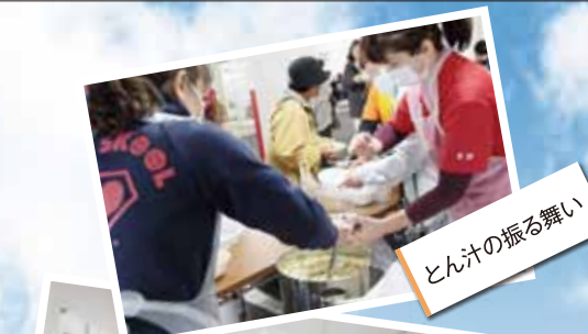
とん汁の振る舞い

11月14日に健康まつりの第2弾として「なじよも収穫祭」が開催されました。協力券でのガラポンや、産直市場での詰め放題にタイムサービス、フリーマーケットや豚汁の振る舞い、縁日コーナーでの射的、鮮魚や焼き芋の販売に寸劇の披露など、大人から子供までが楽しめるお祭りとなりました。当日は多くの来場者で大変な賑わいとなりました。雨が降り足元の悪い中ご来場いただきました皆様には大変感謝しております。ありがとうございます。 なお、今後なじよもでは昨年同様開催した「楽市楽座」を予定しております。詳細は改めてご報告させていただきますが、楽しみにお待ちしております。