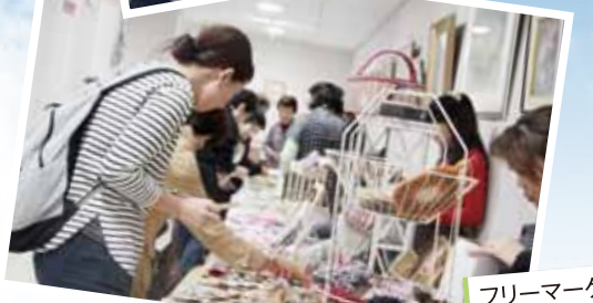
フリーマーケットの様子