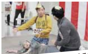
いのちつなぎ隊による寸劇「もし支援が必要になったら」