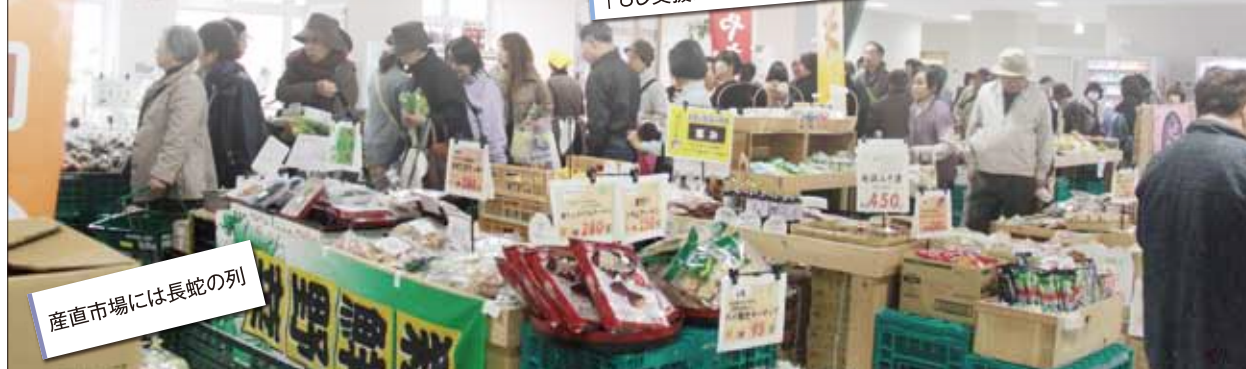
産直市場には長蛇の列