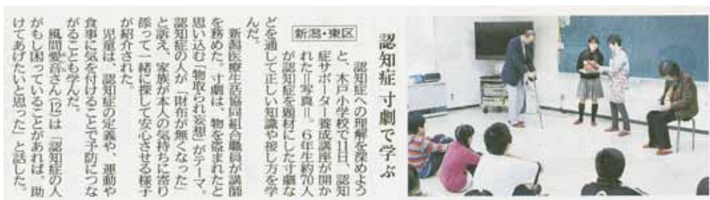
新潟日報にも掲載されました