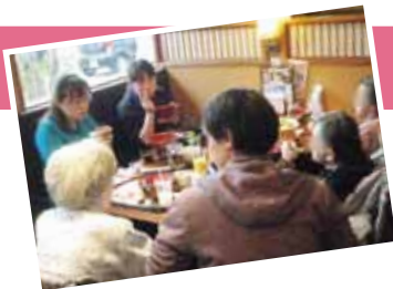
▲いくとびあ後は昼食を楽しみました