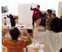
去年の楽市楽座の様子