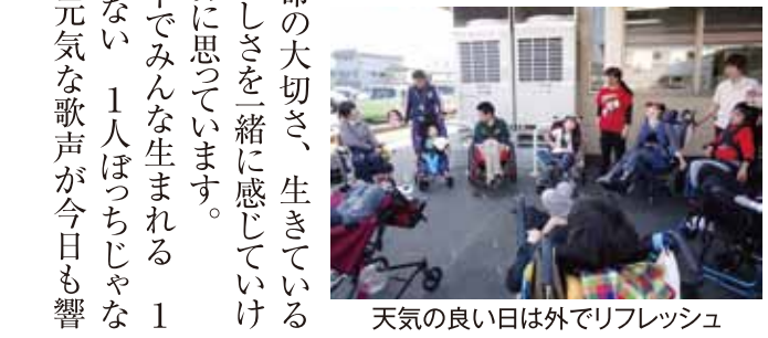
天気の良い日は外でリフレッシュ

時の流れは早いもので、ほがらか福祉園トウインクルは4回目の冬を迎えています。なじよも4号館1階をお借りして開設したBeトウインクルは無事に1年を過ごすことができました。重症心身障がい者(児)の通所支援事業所として東区に初めて開設して以来、たくさんの方々と出会い、つながって来ました。五感から伝わる心の声に耳を傾け、重い障がいがあっても生き生きと