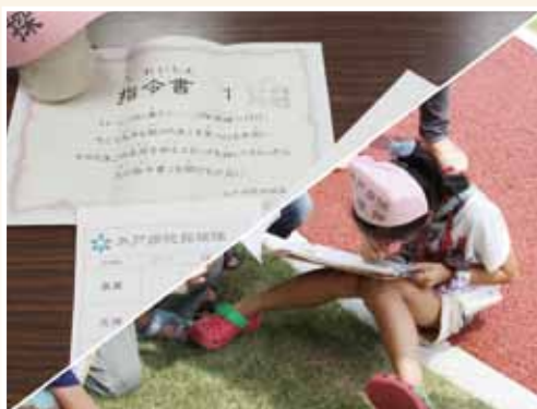
子ども班会:最初の班会は「病院探検隊」

学童保育の保護者会にて、「新潟医療生協の学童保育でしか体験できない事をぜひやってほしい。」との対話から班会の立上げの話が進みました。最初の班会は、「病院探検隊」が予定されています。親子でも体験できるワクワクのプログラムです。木戸病院を本格探検することで好評のプログラムを、班会立上げ記念に春休みに開催の予定です。医療生協ならではの体験をたくさん展開し、楽しく活動して行きたいと思えます。