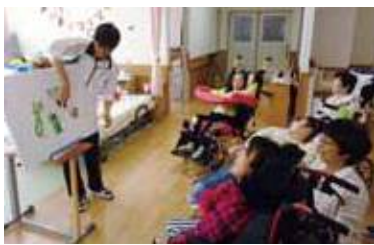
パネルシアターを楽しみました

時の流れは早いもので、ほがらか福祉園トウインクルは4回目の冬を迎えています。なじよも4号館1階をお借りして開設したBeトウインクルは無事に1年を過ごすことができました。重症心身障がい者(児)の通所支援事業所として東区に初めて開設して以来、たくさんの方々と出会い、つながって来ました。五感から伝わる心の声に耳を傾け、重い障がいがあっても生き生きと