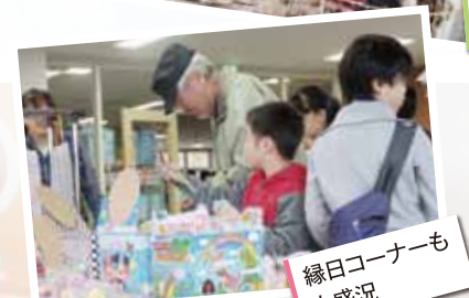
縁日コーナーも大盛況