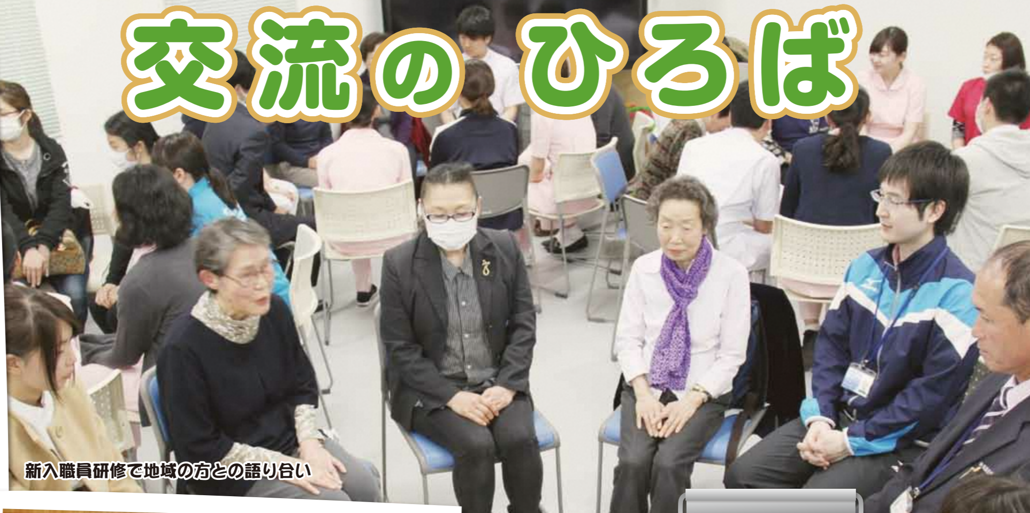
新入職員研修で地域の方との語り合い