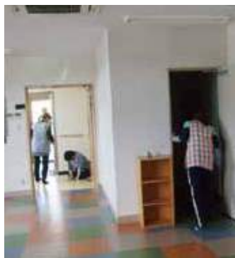
旧生協組織部がカラフルなタイルに張替え見違えました