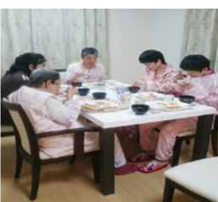
みんなで楽しい夕食

事や誕生会はもちろんですが、レクリエーションの時間も作り、安心した生活の中で、喜びや充実感を持っていただけますよう努めていきたいと考えております。今後とも、よろしくお願い致します。