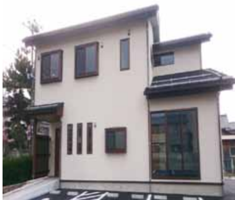
グループホーム「すびか」

今年度は新しい「すびか」を合わせ、40名のご利用者の生活を支援させていただきます。季節の行