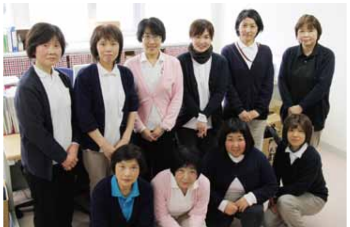
訪問看護ステーションなじよもスタッフは4月に合併しました

人が安心して住み慣れた自宅で暮らすために医師や看護師、ケアマネージャーと連携を取りながら看護をしていきます。今回の訪問看護ステーションの合併によって訪問看護師11名・訪問リハビリ2名の体制となり利用者様一人一人のニーズに寄り添うことができ、よりよくなりました。また24時間365日対応もいたしますので、いつでも臨時訪問を行うことができ、「安心して生活することができ」と利用者様から大変喜ばれています。このように