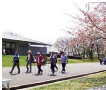
ポールウォーキングに挑戦