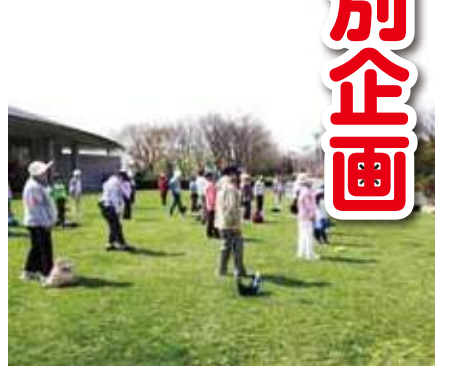
ストレッチでウォーキング準備