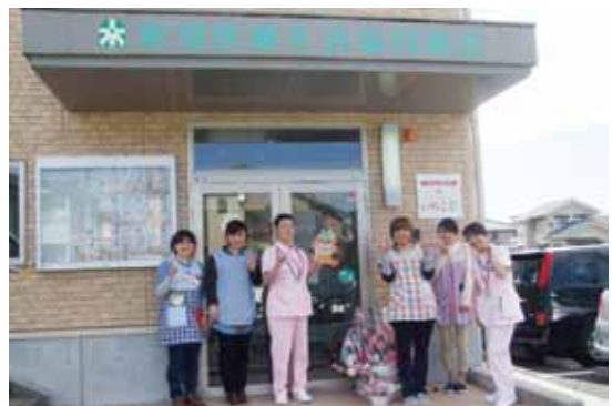
働く親御さん達を保育士と職員でサポートします