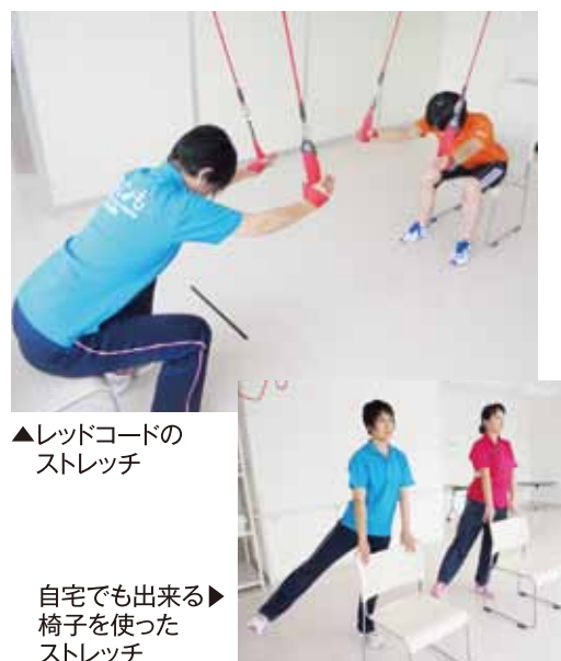
▲レッドコードのストレッチ

健康づくりクラブなじよもは、通所リハビリテーション内のスペースを活用し組合員の皆様の健康づくりをお手伝いします。暖かくなってきた今こそ体を動かすいい季節です。レッドコードのストレッチや、自宅内で出来る運動と一緒にやってみませんか。班会での利用やレク式体力測定も行えます。楽しい日々を送るには、元気な身体が一番です。詳しくは、お問い合わせください。お待ちしております。(電話025-2788433)