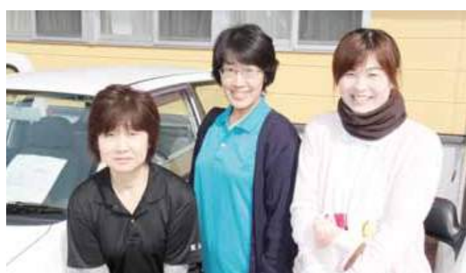
看護師が患者さん宅に訪問します

家族の生活を支えることができる。とてもやりがいのある仕事です。今月は、新緑を見ながら利用者様宅へ向けて車を走らせます。これも訪問看護の醍醐味の一つと言えますね。