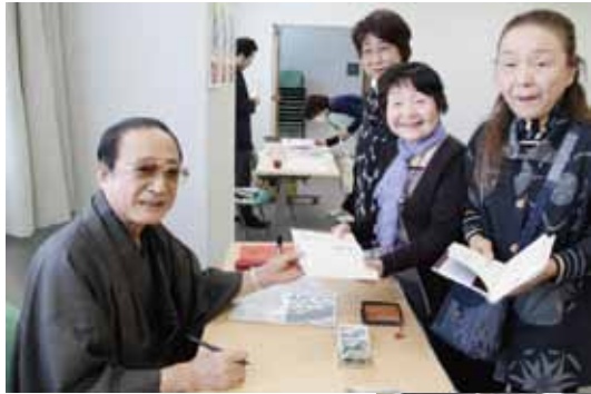
嵐さんのサイン入り書籍の販売も行われました

これがチケットです。1階、2階席で分かれています。医療生協、最寄りの組合員さんにお問い合わせください