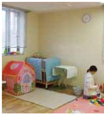
カワイいお部屋でお待ちしています

2016年度も多くの新入職員を迎えました。4月の研修では医療生協の基本理念、歴史、組合員の皆さんとのふれあいを学び、早速班会に参加をしました。地域の公民館で血圧を測り、対話し、多くの組合員さんから「頑張ってるね!」と声を掛けられていました。そして、配属された部署でフレッシュな笑顔で頑張っています。どうぞよろしくお願いたします。