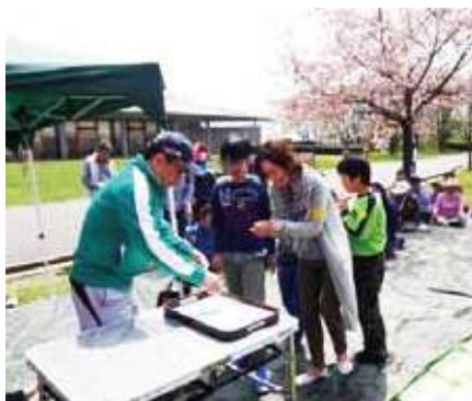
完歩賞が手渡されました