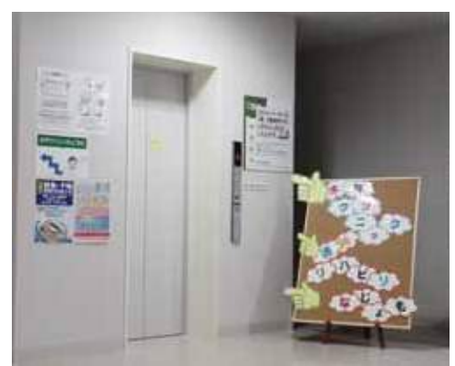
ここを2階へ上がってください(写真の場所は1号館1階)

6月6日、健康ステーションがなじよも5号館から1号館木戸クリニックへ移設されました。木戸クリニックの待ち時間を利用して、気軽にワンコイン(500円)で健康チェックをすることができるようになりました。早速班会で利用した方からは、「以前より広くなって、説明が聞きやすいです」、「食堂が近くなったし、産直市場の買物も楽になりました。すね。」との声が聞かれました。また、