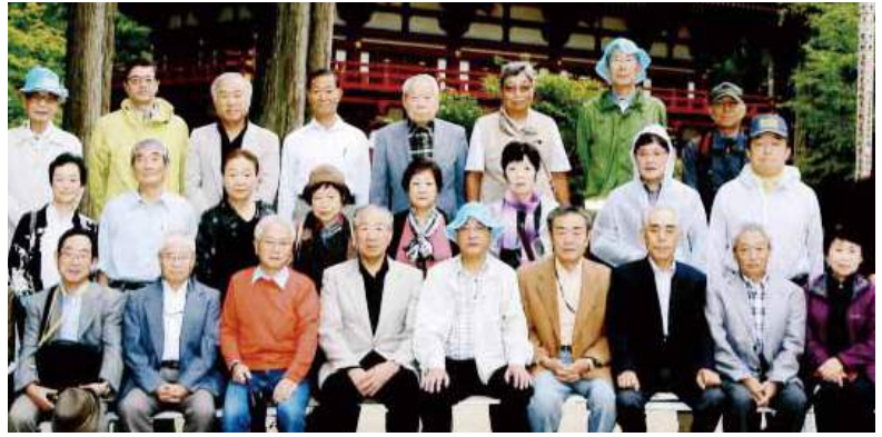
2015年開催の第29回高齢者大会は和歌山で行われました

2016年 第30回日本高齢者大会 in 東京のご案内 70年続いてきた日本の平和を守るのか。それとも戦争法により世界の紛争地や戦争のただ中に自衛隊が出て、人を殺し・殺される危険を許すのか。その歴史的な岐路に立っています。