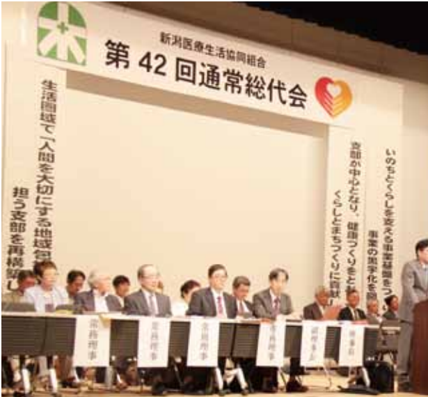
第42回通常総代会 6月26日、東区プラザ・ホール