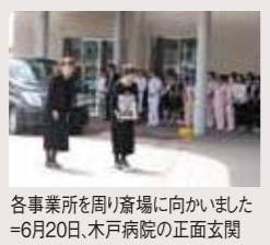
各事業所を回り着場に向かいました =6月20日、木戸病院の正面玄関

日時/8月21日(日) 11:00~14:00 場所/ANAクラウンプラザホテル新潟 詳細は地域活動部へお問合せ下さい 地域活動部/025-274-7139