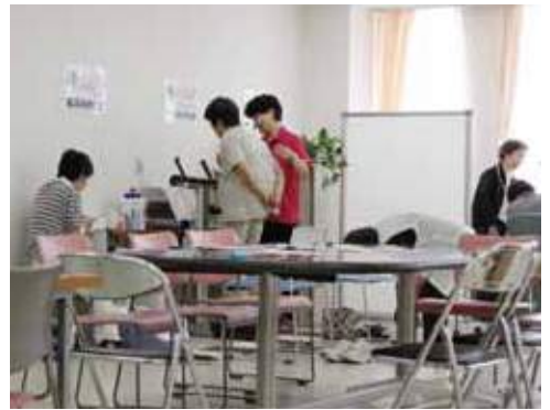
健康ステーションが移設して以前よりも広くなりました

6月6日、健康ステーションがなじよも5号館から1号館木戸クリニックへ移設されました。木戸クリニックの待ち時間を利用して、気軽にワンコイン(500円)で健康チェックをすることができるようになりました。早速班会で利用した方からは、「以前より広くなって、説明が聞きやすいです」、「食堂が近くなったし、産直市場の買物も楽になりました。すね。」との声が聞かれました。また、