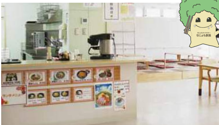
会場の「なじよもカフェテリア」は大きな食堂スペースになっています