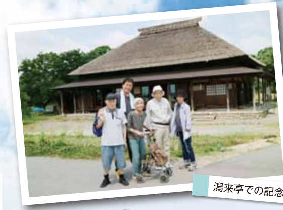
潟来亭での記念写真

おしゃべりは楽しい。外は楽しい。また行こうと参加者からは次への意欲を見せていました。