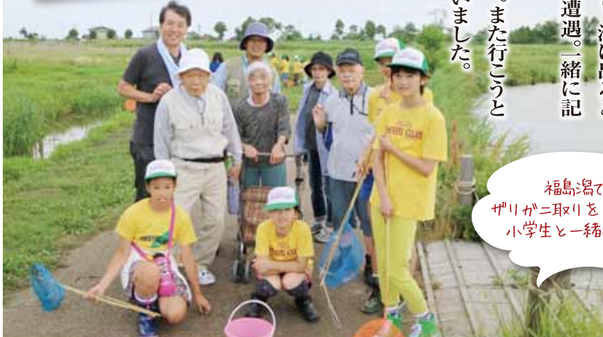
福島潟でザリガニ取りをしていた小学生と一緒に撮影