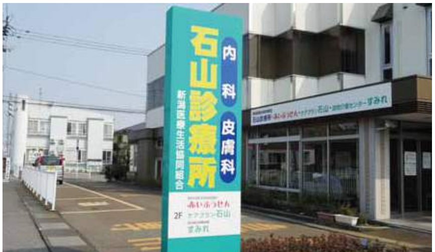
訪問介護センターすみれは石山診療所の2階です

訪問介護センターすみれは、経験豊富なヘルパーがご利用者さまのご自宅に伺って身の回りのお世話をしたい、いつも通りの生活ができるようサポートしていきます。また、すみれでは、介護保険外の「訪問介護自費サービス」の実施をしています。自費サービスで、先日次のような支援を実施したのでご紹介いたします。