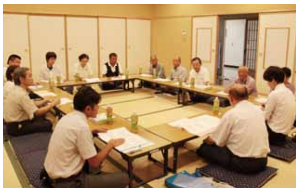
お昼から開催された分散会の様子