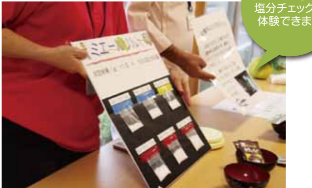
「すこしお」では塩分チェックを体験できます

「すこしお」の味噌汁チェックを色々体験してみませんか。ご自宅のいつもの味噌汁を200mlご持参下さい。市販の味噌汁と塩分・味を比べてみましょう。常日頃の尿塩分もチェックしてみましょう。 日 時:7月29日(金) 9:00受付 9:30~12:00 場 所:なじも5号館1階 健康維持・交流室 申込締切:7月26日 参 加 費:200円