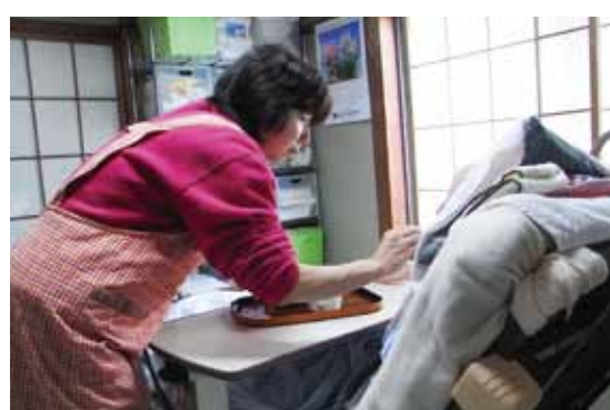
あしめ荘ヘルパー室ではたくさんの経験豊富なベテランヘルパーで支援しています

その後、介護保険が導入され、現在あしめ荘のヘルパー室は1ヶ月で70名程の実利用者が延べで600件利用されています。その頃からの職員も含め3年から20年以上の経験を持つベテランヘルパーで支援し、利用者さんケアマネージャーから厚い信頼を受けています。介護保険の介護サービスの原点は「自立支援」です。私たちヘルパーは利用者さんが「何らかの支援を受ければ住み慣れた地域や自宅での生活が継続できる」。または、その希望が実現できる