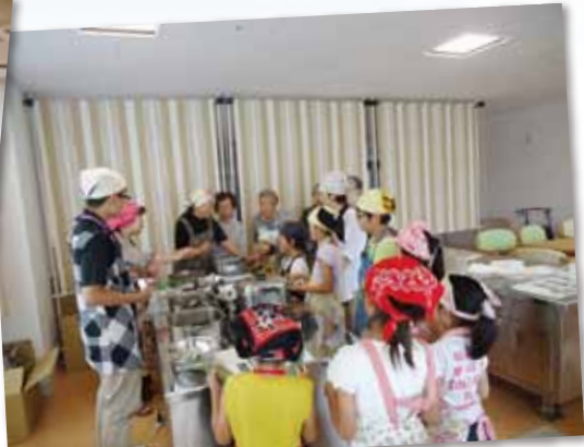
サ高住入居さんと学童の子どもたちで笹だんご作り =7月2日、なじよも