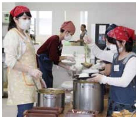
たくさんのボランティアさんに支えていただきました