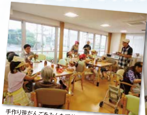
手作り笹だんごをみんなで美味しくいただきました