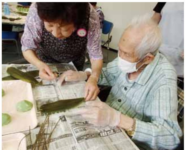
笹だんご作りに利用者さんやボランティアさんも参加

6月29日に笹だんご作りをしました。午前中から参加、お手伝いをしていただいた利用者さんとボランティアさん、職員とで集まり、3時のおやつに間に合うように約150個の笹だんごを一生懸命作りました。普段とは違う雰囲気の中、利用者さんに笑顔や会話がふれ、とても良い気分転換になったと感じました。笹だんご作りにも参加できなかった利用者さんもおやつに喜んで、「若い頃は作ったのよ」と昔の話をしていたたり、「美味しい、美味しい!」と言われ3個もたいらげてしまう方もいらっしゃいました。日々のリハビリの他に、笹だんご作りのような体験や参加型のレクリエーションも取り入れていき、いきいきと生活していただけるように今後もレクリエーションの計画をしていきたいと思います。