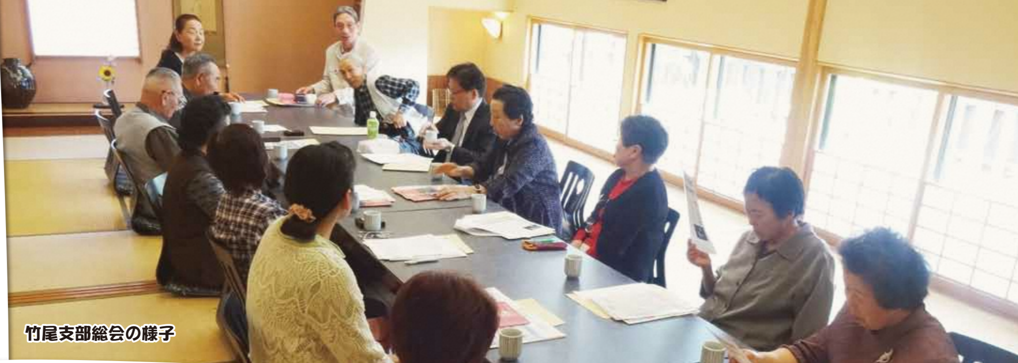
竹尾支部総会の様子