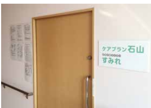
ケアプラン石山は石山診療所の2階にあります