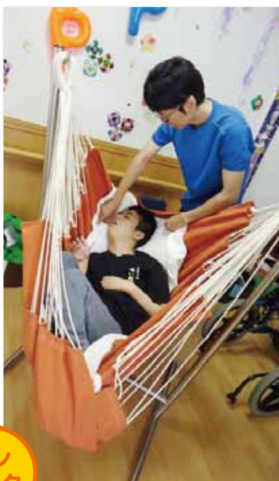
ブランコのような揺れを楽しんだり、ゆったりリラックスもできます。