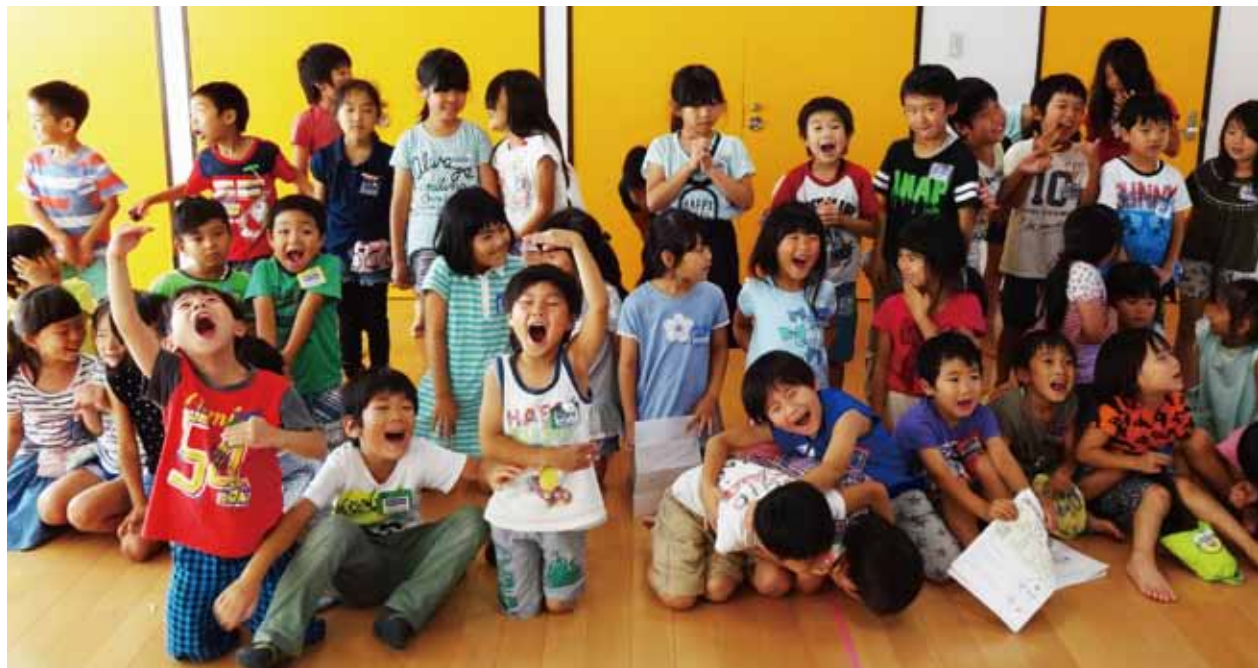
子どもたちを対象に「歯のはなし」を開催。みんなピカピカのお口で笑顔になりました = 7月22日、学童クラブなじよも

「食べる」ことから集い、語り、助け合い、出会いの場になったり…。 そんな思いが集まって、7月8日(金)新潟医療生協の「子ども食堂・元気百倍レストランなじよも」がプレオープンしました。 7月に入ると、じゃがいも、にんじん、とうもろこし等の野菜が近隣農家の皆さんからたくさん届きはじめ、「提供してもらった食材から何が作れるか」をみんなで考えた末、メニューは「カレーライス」となりました。今回のプレオープンは、近隣農家の皆さん、ボランティアさん等多くの方々を支えていただいたからこそ実現できた子ども食堂です。(関連記事4面に)