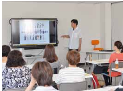
前回の介護福祉士実務者研修の様子