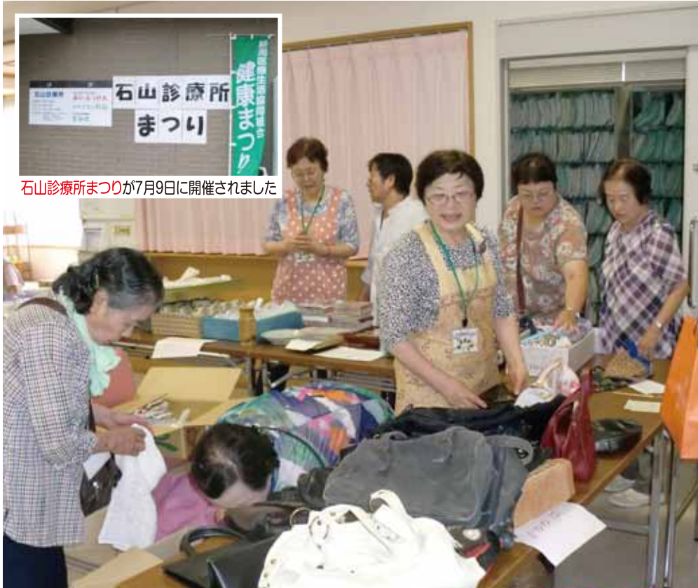
石山診療所まつりが7月9日に開催されました

介護を受ける利用者の生き甲斐について、国は自己責任として扱おうとしています。しかし、歩行に問題が無いといって要支援から外された場合、また以前と同じように「家族の中では役割を持っていなかった」と言われていた時に戻ってしまうかもしれません。適切な介護サービスの提供とは、一人ひとりで違いがあるのではないのでしょうか。今回のように要支援という軽度要介護度の方にとって、生き甲斐が持て、そのことが励みになるなら、「今の状況を維持させること」も、適切な介護サービスの提供になるように思います。