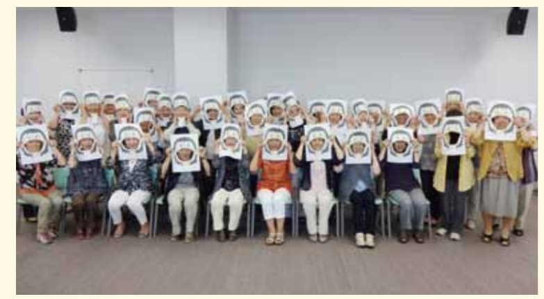
舌を動かし、みんなで楽しく美人に