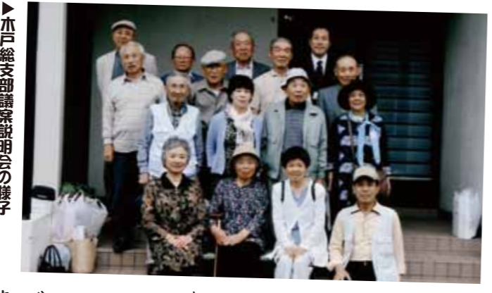
本戸総支部議事説明会の様子

新崎支部の年一度の親睦旅行が五月三十日(月)に実施されました。当日は晴れのいい天候にも恵まれ、一行十六人は、三川温泉「まる」旅館へ！実は昨年と同じ処でしたが、あまりの評判の良さで連続の催行となりました。中には温泉に入るのを忘れてしまった人もいました。食べきれない程の美味しい料理とお酒と、カラオケを肴に時間が経つのも忘れての、和気あいあいの春の一日でした。