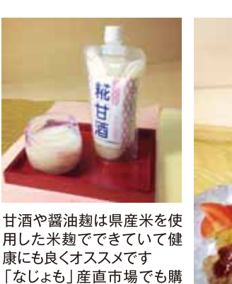
甘酒や醤油麹は県産米を使用した米麹でできていて健康にも良くオススメです。「なじよも」産直市場でも購入できます