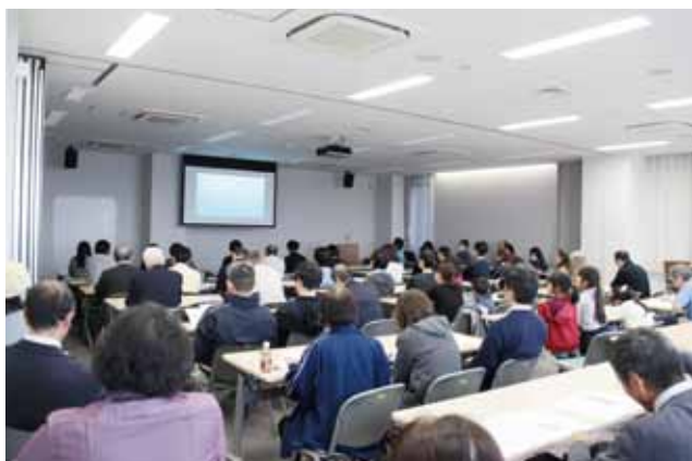
地域の活動の様子、事業所の活動を組合員と職員と一緒に学びました