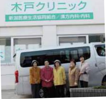
木戸クリニックに到着

接種後は、なにも産直市場を訪ねてお買い物も楽しみました。みなさんも、木戸クリニックに相談してはいかがですか。まだ間に合いますよ。健康で冬を乗り切りましょう。