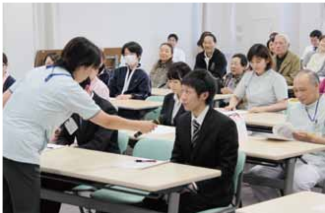
次年度入職予定の方に感想を...これが医療生協です!一緒に頑張っていきたいと思います!

この発表により「医療生協というものが具体的に理解できた」との声も聞かれました。事業所や地域の活動をお互いが理解協力することによって、更なる飛躍が期待される会となりました。