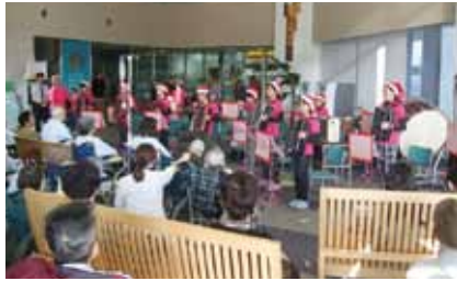
昨年の演奏のようす

クリスマスコンサートが木戸病院1階エントランスホールを会場にクリスマスイブの12月24日(土)14時より開催されます。クリスマスメドレーや演歌メドレーなどを演奏します。子どもたちの素敵な演奏をお楽しみください。