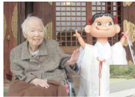
ペコちゃんとの記念撮影

ペコちゃんとの記念撮影でご満悦！千歳館も買えて、さらにご満悦!!これからの時期、買い物や外出などのレクリエーションは難しいですが、屋内でも楽しめるような内容を考えて、利用者さんに楽しんでいただきたいと思えます。