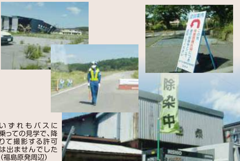
いずれもバスに乗っての見学で、降りて撮影する許可は出ませんでした(福島原発周辺)

なりました。事故から1年後にいわき市が市民アンケートを実施した結果、人口の55.4%にあたる18万3000名が一時避難していることが判明しました。さらに、南相馬市、福島市、郡山市など福島県内各地からも約15万人と多くの人が避難しており、事故直後には県全体で40万人前後の人びとが避難したとの事でした。 訪県した9月、新しい住宅や洗濯物が干してあり生活感があると思っただけですが、それらは5年前の洗濯物だと聞き、当時の事故の無残さを痛感しました。(なじよも・佐野)