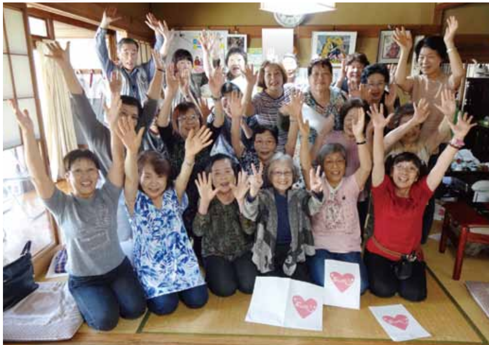
亀田こぶし班で広がる笑いヨガの様子

木戸病院つてそんなことやってんだあ 10月、医療生協に、ある老人ク ラブの会長が訪ねてきました。 「夫婦で曾野木の公民館で行われ た文化祭を見学に行った際、骨密 度チェックを行っていたのに興味を 覚え、どこがやっているのか調べる と、木戸病院だということがか りました。そこで、ぜひ、うちの老 人クラブでもやってもらいたい」と のことでした。職員が、「組合員3