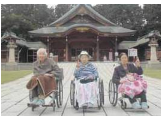
今回の外出レクリエーションは護国神社へドライブ

普段は施設の中で生活されている利用者さんに、「日常とは違う時間を過ごしてフレッシュアップ」していただくために外出レクリエーションを行っています。付き添いが欠かせないため大勢では行けませんが、10月末は護国神社へドライブに行ってみました。少し肌寒い日でしたが、み