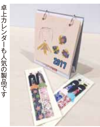
卓上カレンダーも人気の製品です

日常生活、園での作業、外部での販売、わたしたちは様々な場面で地域のみなさんに支えられ生活し、働くことができます。毎日感謝の気持ち忘れずに励んでいきますので、これからもよろしくお願ひいたします。