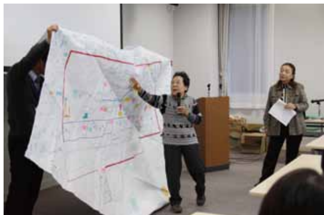
「あなたは自分の地域をどれだけ知っている?」竹尾支部の4mの地図です