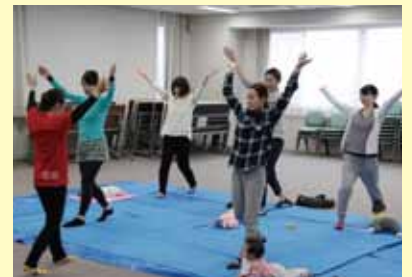
赤ちゃんと一緒に運動。(11/2の模様)

参加された方からは、「動かすとこんなにカラダが楽になるんだね」「赤ちゃんと一緒に参加できて楽しかった」「赤ちゃんがぐずった時、体操を主人にも教えます」「同じママ同士、おしゃべりもできて良かった」など、いろいろな感想をいただきました。withではスタジオ貸し等も行っておりますので、詳しくはお問い合わせください。(TEL 025-278-3876)