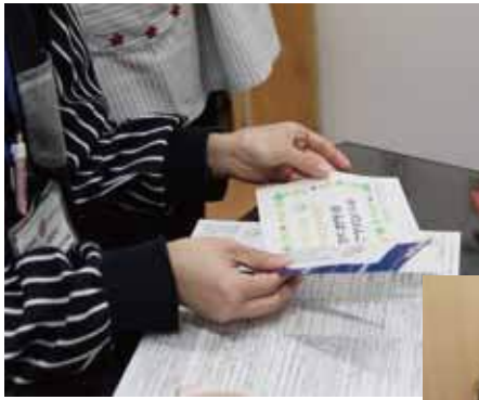
保護者、キッズ(園児)達からの感想もありがとうございます!しっかり活かしていきます!!