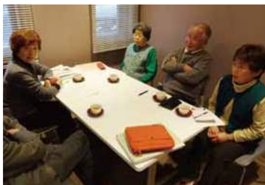
ここでカフェ開けないかしら?ボランティアも出来るわね!

新潟医療生協40年の歴史の中でつくられた、安心のネットワークを知らせ、利用してもらうために、「集まれる場」をもっと多くつくるのが求められています。そのためにも新潟医療生協の最大の魅力「班会を増やしていきます」。