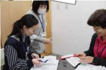
「頑張り」「積極的」園長から前向きな言葉をたくさんいただきました