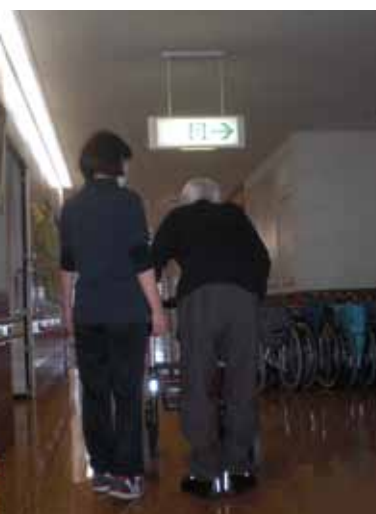
「笑顔」を合言葉にリハビリやレクリエーションを行っています

また、少し前から利用者さんより「ショートステイあしぬままで『リハビリをしてほしい』という声が多かったのですが、10月より作業療法士が勤務となり、ご要望にお応えできるようになりましたので是非ご利用ください。