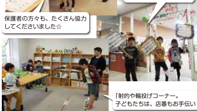
「射的や輪投げコーナー。子どもたちは、店番もお手伝い♪」

「射的、輪投げ、やります！僕たちの手作りアクセサリーもあります！」と、呼び子としてなじよも中に宣伝もしました(^^)