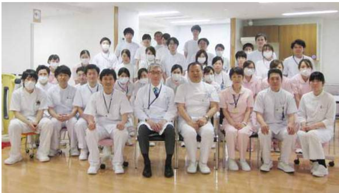
所澤診療部長(前列中央右)、本間リハビリテーション科部長(同左)とスタッフ一同