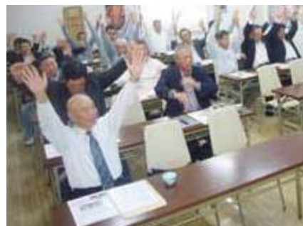
笑うことで体内のさまざまな筋肉が動きます(「ゲラゲラ筋」) 笑いヨガではこの筋肉をしっかり動かします

失われつつある人と人とのつながりを、新たに紡ぎ、笑顔あふれるまちづくり、近所の組合員の方と集まり、語り合い、健康づくりの場「班会」を開きましょう。