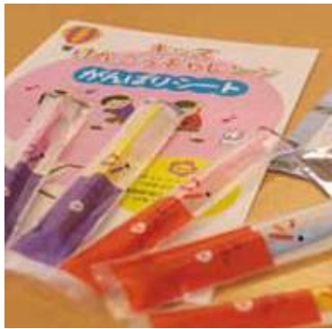
今年の参加は358名! その分プレゼントも増えました

りますか?」とか。このころ言ってもうりました(笑)「そのころは、恥ずかしくて挨拶できない園児も、小さい声ながらも「おはよう」と挨拶してくれる姿を見たのがうれしかったです。」「と話していただきました。みんな頑張っていて、みんな達成!!気持ちいいですね。