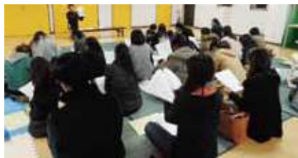
説明会には26世帯という多くの保護者の方々にご参加いただきました

2017年度は、30名近くの新1年生が加わり、80〜90名の大家族になります。人数が増える分、色々な問題も増えるかと思いますが、その1つひとつを、子どもたちの豊かな経験に変えられるよう、保護者や地域の方々の力を借りながら