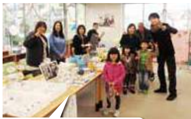
保護者の方々も、たくさん協力してくださいました☆

産直奥の部屋を学童クラブのブースとして「射的」「輪投げ」「手作りシヨップ」を開きました。大賑わいの学童ブース。店番には、学童クラブの保護者や子どもたちが集まってくれ、元気な子どもたちの声が響いていました。「手作りシヨップ」では、子どもたちが心を込めて作った髪止め・髪ゴム・マグネットを売りました。この日に向けて、商品を一生懸命作る姿がありました。そして、買ってくれた時の喜び、売ることの難しさ、仲間と一緒に作る楽しさなどなど、今回の経験を通して多くのことを吸収してくれました。