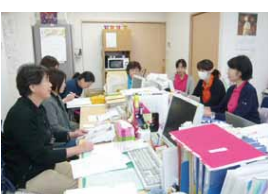
もっともっと満足してもらうためには...勉強会も熱気十分です

これからも地域の方やガーデンを利用の体制を整えました。私たちは常に「質の高い訪問介護、より良い支援」を提供するために、向上心を保てるようヘルパー同士が講師となり、月に一度勉強会を開催しています。