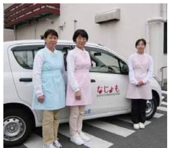
訪問前に撮影を。行ってきます!よろしくお祈りします!

なじよもには「訪問介護センターなじよも」と「定期巡回・随時訪問介護看護ありがとう」という事業所があります。地域の利用者さんや、なじよもガーデンの入居者さんに「安心・安全」のお届けを心がけています。