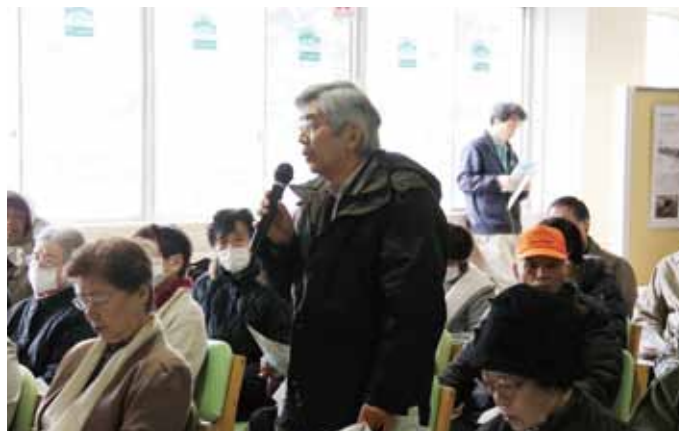
講演後には、活発な質問が出されました