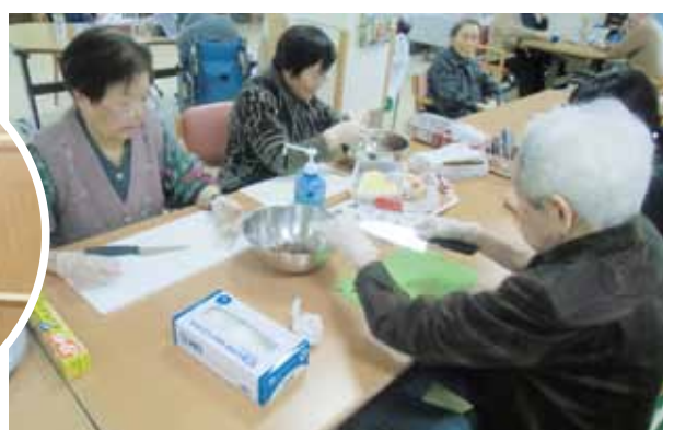
チョコレート作り頑張ってます