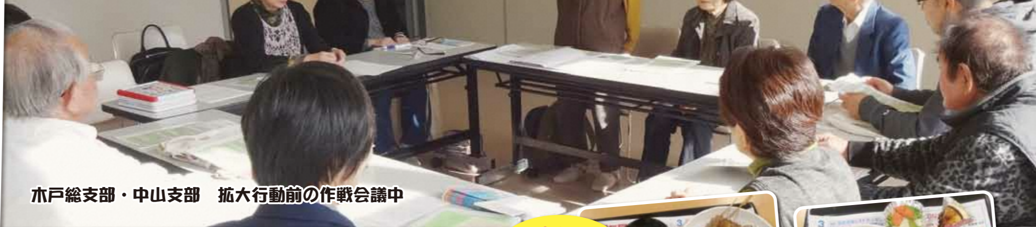
戸部総支部・中山支部 拡大行動前の作戦会議中