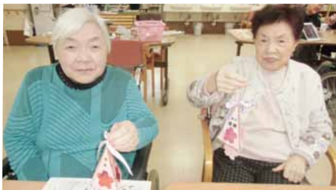
みんなで楽しくステンドグラスを作りました

リハビリの一貫である季節に応じたレクリエーションを紹介しました。2月はバレンタインデーイベントとしてチョコレート作りを行いました。利用者さんにチョコレートに刻んでもらったり、丸めて形にしたり、職員と意見を出し合いながら、かわいいロリポップショコラを作りました。最後にリボンで可愛くラッピングをして完成!味も見た目もバッチリで、調理にたずさわらない男性の利用者さんにも、楽しい、おいしいと大好評で、皆さんとても喜ばれていました。