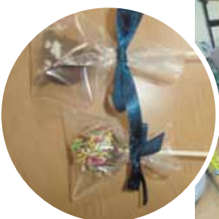
これがロリポップショコラです!