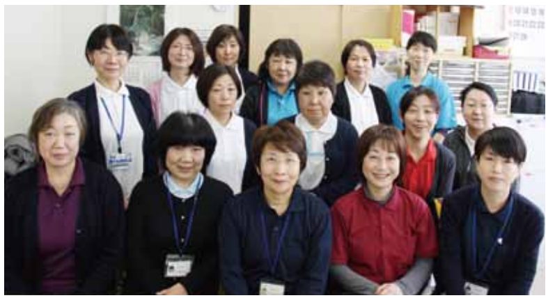
15名のスタッフで地域の訪問へ伺います

訪問介護員の体制が今まで以上に整いましたので、定期巡回をより多くの方からご利用頂けるようになりました。新潟医療生活協同組合の強みでもある、医療・介護の連携を進めながら「住み慣れたまちでずっとでも安心して暮らしたい」の思いに関わつていきたいと思つています。これからも多くの方の笑顔に出会えるよう、頑張りますので応援よろしくお願いします。