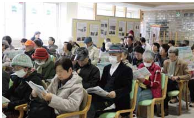
総合事業の説明に耳を傾ける参加者のみなさん

新潟医療生活協では、行政の制度に対応した事業(図)を開始、3月には訪問介護センターすみれと訪問介護センターなじよもが合併を行い、大規模の「訪問介護センターなじよも」となりサービスの提供も充実できるようになりました。