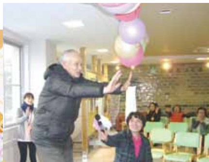
地域の方からは「健康づくり法」の発表