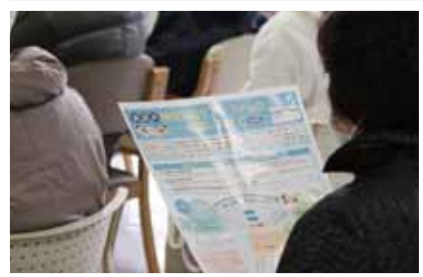
新潟市が配布している「地域包括ケア」の資料