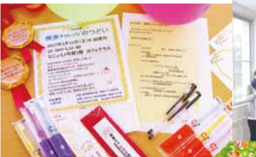
参加者には歯ブラシなどのプレゼントもありました

の方に健康チャレンジにご参加いただきありがとうございました。これからも「たのしい健康づくり」にチャレンジしていきましょう。