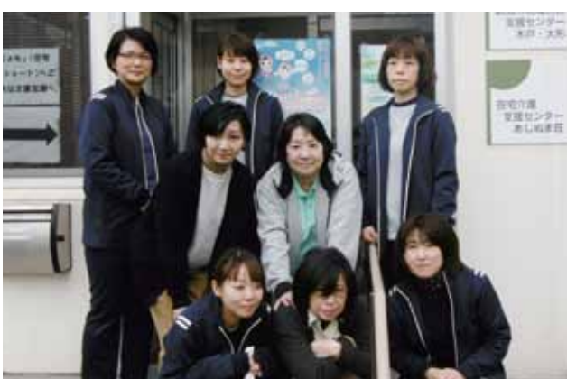
私たち8人のケアマネジャーが皆さんをサポートいたします

4月からは新潟市が実施する新しいサービスが開始し、地域の自治会、住民主体のボランティアの方々と協力して高齢者の方々を支えていく日常生活支援総合事業が始まります。みなさんの困ったを解決する相談窓口としてお待ちしております。