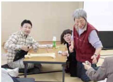
セミナー終了後には参加の方々が先生の近くに来て質問していました

感じた」「ヒザが痛くならないように、日常的に予防体操をやっていききたい」などの声がありました。