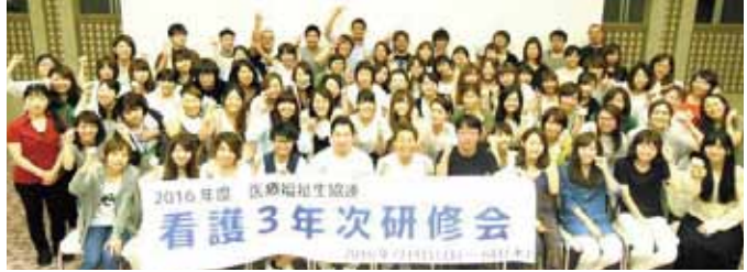
全国の医療福祉生協から集まった看護師のみなさん

2016年7月、入職3年目の看護師3名が広島にて行われた3年次研修会に参加しました。この研修では日本各地から約50名の