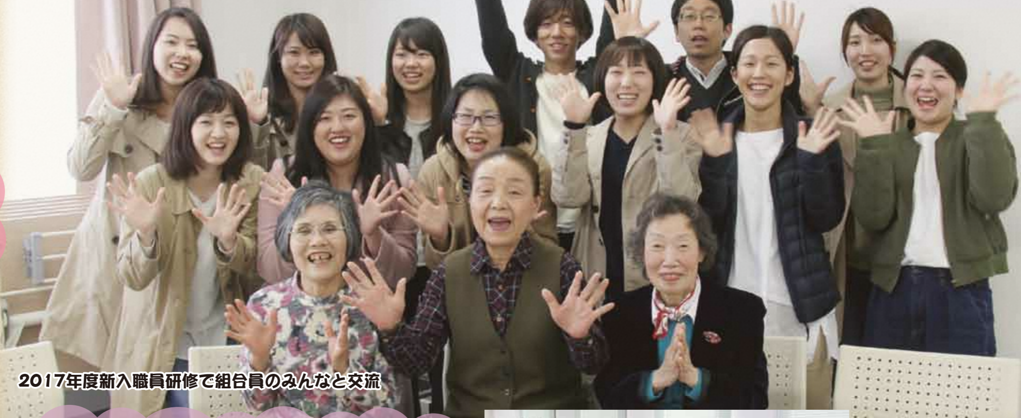
2017年度新入職員研修で組合員のみなさんと交流