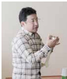
病院で実際に使用している器具などを持ってきて丁寧に説明

病院で実際に使っている器具や骨の模型を持参し、非常にわかりやすい説明でした。時折、先生からの笑い話もあり参加者のみなさんも楽しそうでした。参加された方からは「先生のお話がとてもわかりやすかった」「ヒザの手術にもいろいろ種類があって、早めの受診が大切と