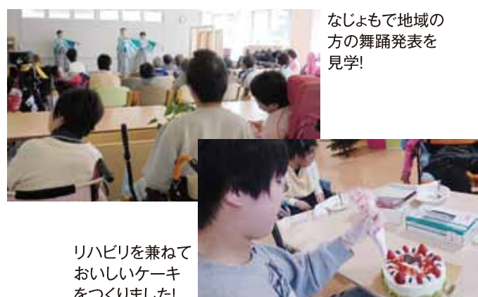
なじよもで地域の方の舞踊発表を見学!