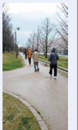
by指ぱっちゃんのポール牧さんより

スタート前に、詳しい指導を受けた後にポール使用ながら2km以上を楽しく歩く事が出来ました。後日、ウォーキングマシーンで歩くと、以前より足の動きがなんとスムーズになり(気が付くと先日のポールウォーキングの歩き方をイメージして歩いている)そんな自分に大変驚きました。これからも自分で思った行動を安全に出来る事が生活の基本と考えていますので、又いつでも自由な動作が日々出来るための身体トレーニングを続けて行きたいと思っています。