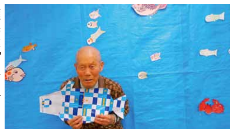
水族館へ変身で「とったとー!!」

身体状態は個々に違いますが、お互いを尊重し、社会の一員として存在していることの喜びを職員と一緒に全身をフル活用させ表現しています。今後は、生活体験を増やしたり、たくさんの方々の出会いを楽しむため、地域との交流をしていきたいと思っておりますので、みなさんのご理解、ご協力をお願いいたします。 Beトウインクルにいつで