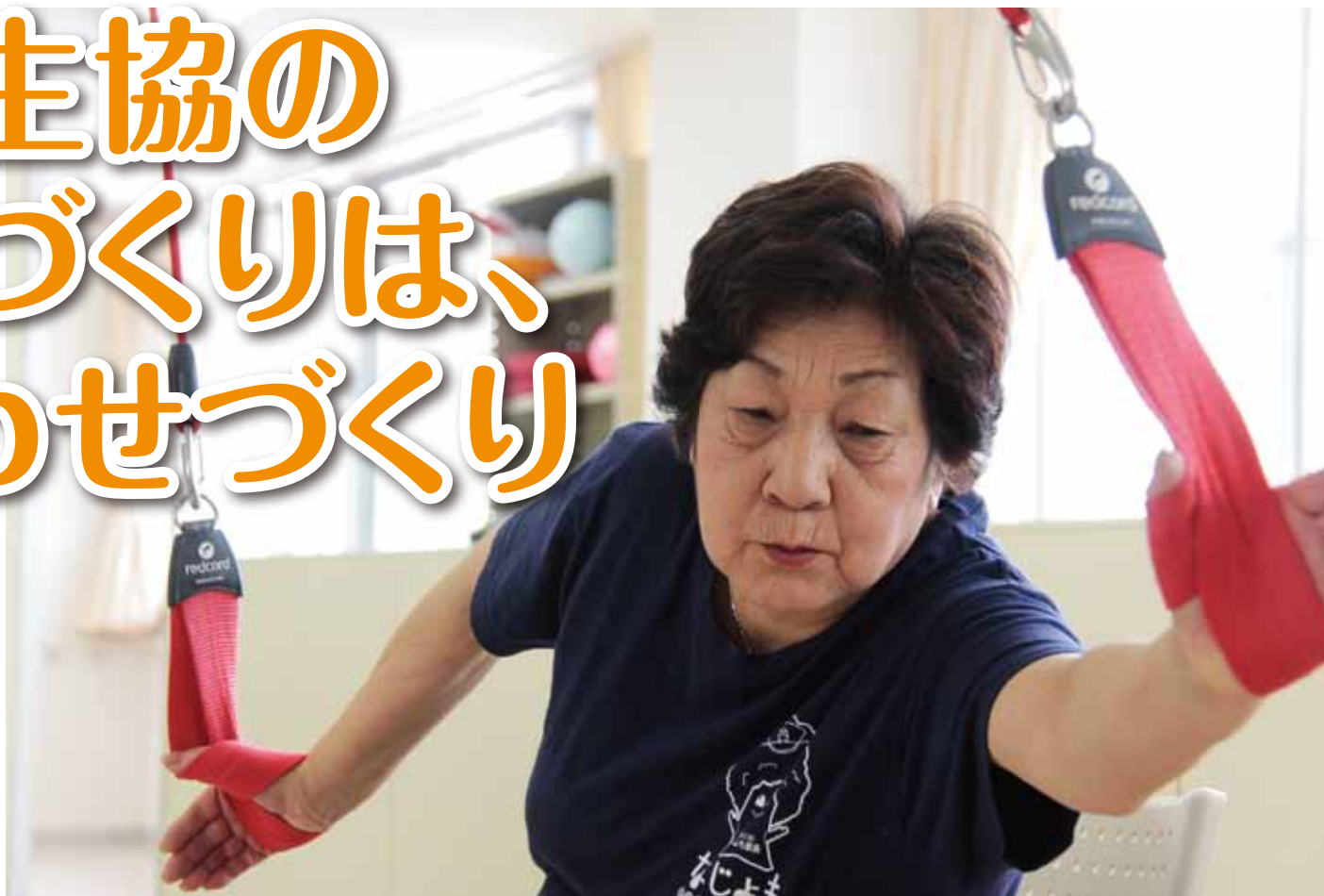
天井から吊るされた2本のコード(赤いロープ)でストレッチングを行います=4月17日、通所リハビリテーションなじよも

私たち新潟医療生協では、これまで進めてきた健康づくり運動をさらに広げ、運動・食生活など個人の生活習慣を見直して、それを改善していくことを目標としています。(健康寿命の延伸)