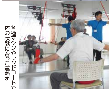
各種マシンやレッドコードで体の状態に合った運動を