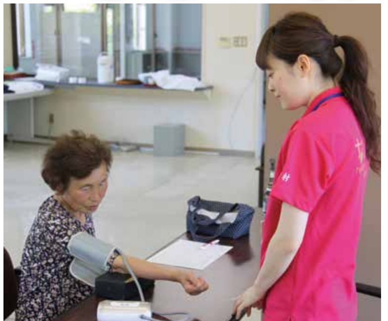
首野木出張所「結いの郷(ゆいのさと)」では健康チェックが行なわれました