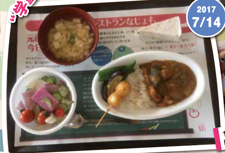
1周年のメニューは第1回と同じく「カレーライス」

新潟医療生活協同組合員現勢 (平成29年6月30日現在) 組合員数:43,524名 出資金総額:21億6,217万円