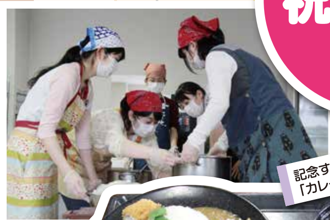
記念すべき第1回目のメニューは「カレーライス」