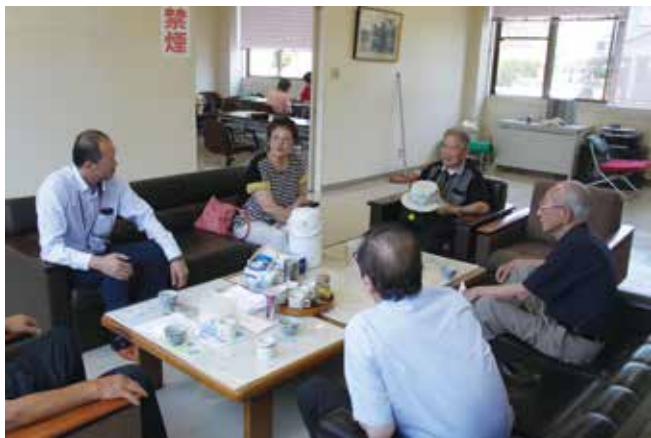
曾野木出張所の名前やこれからの活用について話し合いました