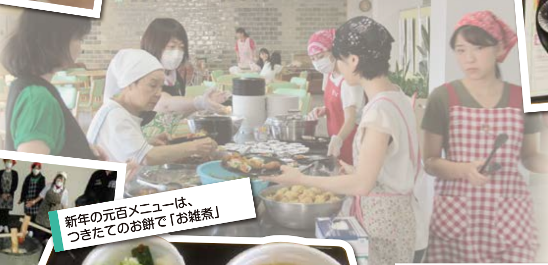
新年の元百メニューは、つきたてのお餅で「お雑煮」