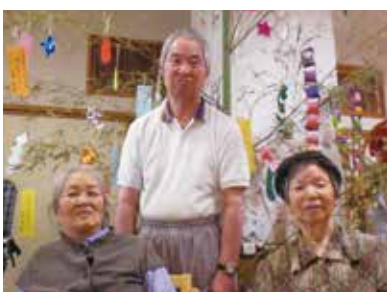
クラブ活動へはそれぞれ役割を持って楽しく参加しています

とを維持する効果があります。100点満点が取れるような個々に合わせた範囲で学習し、すぐに採点、褒めること、コミュニケーションを取り、楽しく行うということが大切です。もう1つはクラブ活動です。園芸・工作・生け花・料理に個々が得意なことやできることを、役割を持って参加されています。学習療法もクラブ活動もご利用者さんとはとても良い表情を見せて下さいます。これからもさ