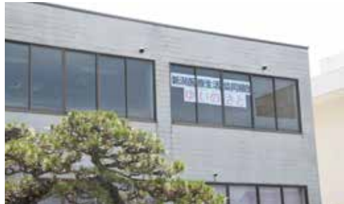
2階の窓には「ゆいのさと」の目印もあります

7月8日(土)に曾野木出張所(旧亀田郷鳥改良区・曾野木出張所)にて千人会議が開催され、名前が「結いの郷(ゆいのさと)」に決まりました。「おたがいさまが助け合い、『人と人が結びついていく』居場所」にしたいという願いが込められています。 また当日は、保健師による骨密度チェックや血圧チェック等が開催され、日頃から健康に気を使っている方々が結いの郷に集まりました。この「結いの郷」ではこれから