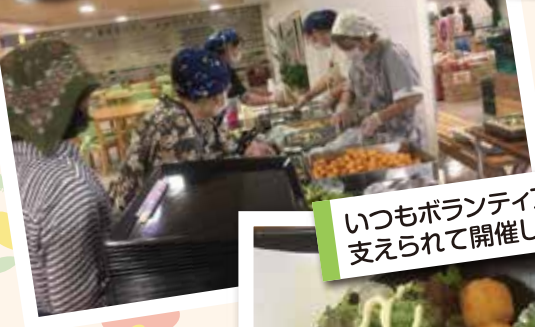
いつもボランティアのみなさんに支えられて開催しています