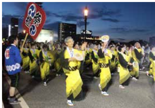
今年の踊りは万代橋中央あたりからスタート

新潟医療生協の万灯を先頭に、揃いのゆかたやほっぴ、Tシャツで「ありゃさ、ありゃさ木戸病院」「ありゃさ、ありゃさ芦沼」と氣勢を上げました。