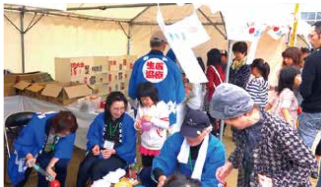
今年の健康まつりでも「各総支部からの出店」が行なわれます(写真は昨年の様子)

生協強化月間の期間は9月25日～11月30日。月間到達目標は年間目標の8割です。仲間ふやしは1200人、出資金ふやしは1万