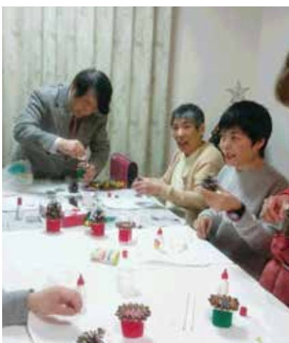
楽しいクリスマスツリー作り

フトやゲームなどで笑いがいっぱい時間を過ごしています。これからも、個人の楽しみを尊重しながら、皆で一緒に過ごす時間の大切さも伝えていけたらと考えています。