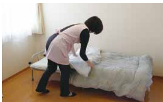
ベッドメイキングなどの生活支援を行います。

現在、ご利用されている方から「ヘルパーさんに手伝ってもらって助かった」「前回作ってもらった料理はおいしかったよ」と笑顔で言っていたのはとてもうれしく励みになっています。また、育てている花や畑の様子、昔話や生活の知恵を教えることもあり、へ