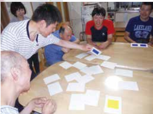
赤・青・黄色のカード合わせゲーム