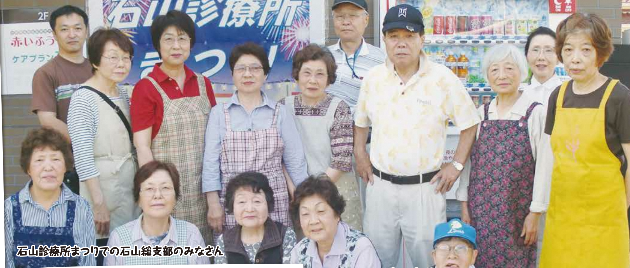
石山診療所まつりでの石山総支部のみなさん