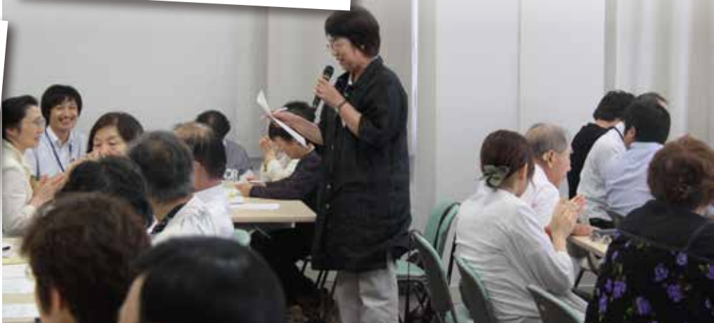
各グループで話あった結果を発表しました