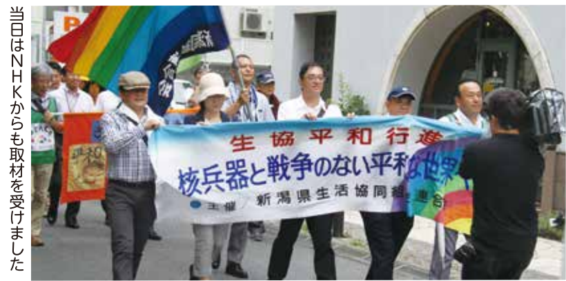
当日はNHKからも取材を受けました