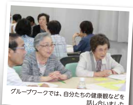
グループワークでは、自分たちの健康観などを話し合いました