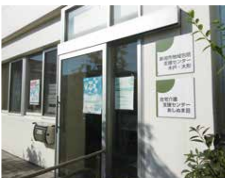
事務所はなじもの1号館1階です

高齢者の権利を守り、成年後見制度につなげたり、高齢者虐待の防止に努めています。なじもの1階にありますのでお気軽にご相談ください。