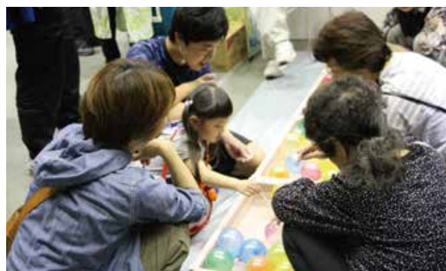
スーパーボールのブースには親子で楽しむ姿もありました

始めて健康まつりに来ましたが、健康について様々な企画があっても参考になりました」と入った感想が聞かれました。