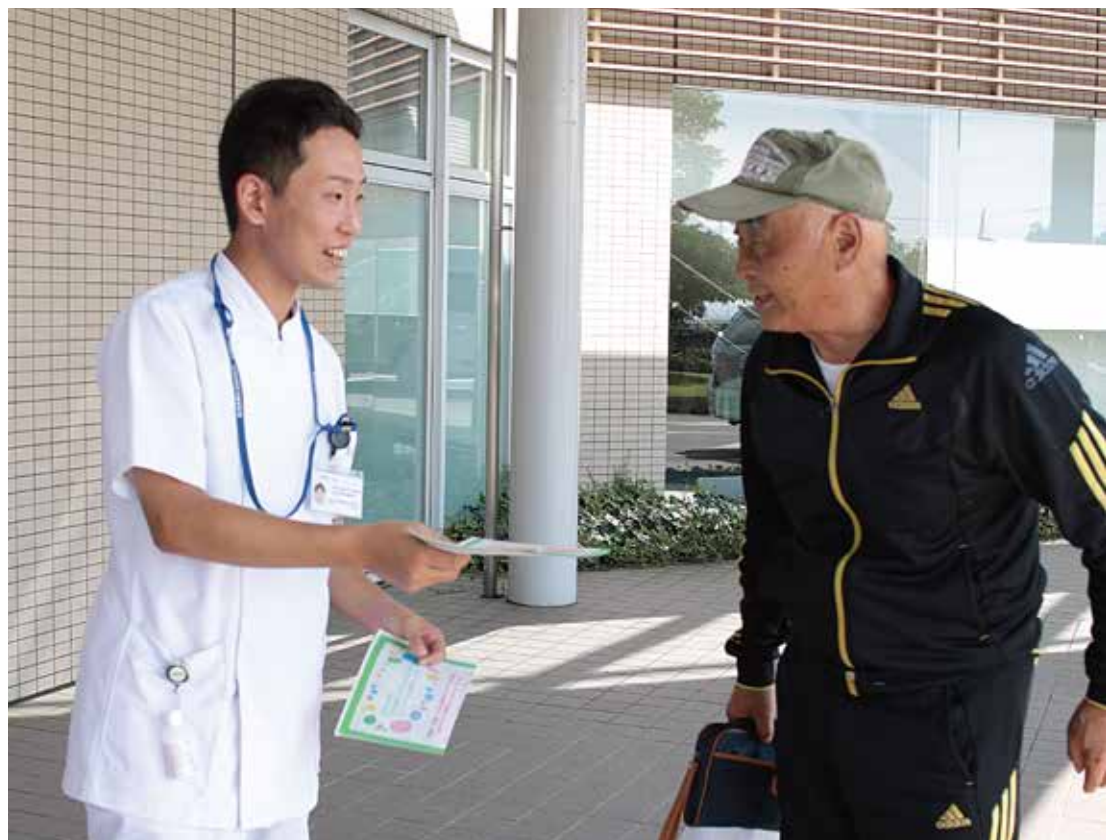
地域では、組合員の拡大行動が既に始まっています

〔1〕私たちが取り巻く社会状況は、「安心して暮らす」とは言い難い「現状です。人口構造の急激な変化に対応した政策が十分に進められておらず、地域では様々な問題が生じています。 他の生協や連合会の総代会の議案の中でも、多くの課題が指摘されています。その内いくつかの例が下記となります。