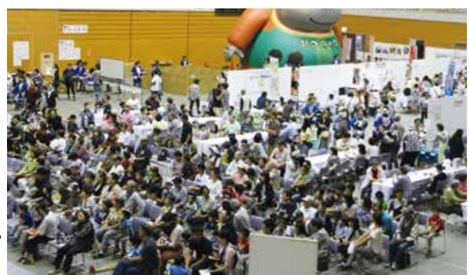
メインアリーナには子どもから大人まで楽しめるエリアがたくさん