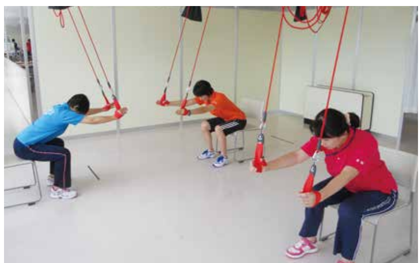
レッドコードがご利用頂けます

提供時間は9時30分〜12時30分でサービス内容は、送迎・バイタル測定・専属トレーナーによる運動(マシン、レッドコードなど)・大浴場での入浴(希望制)・昼食・産直お買い物(希望制)などです。お話を聞いてみたい方、運動に関心のある方等々何でも構いませんので、お気軽にお問合わせください。 (08095598457)