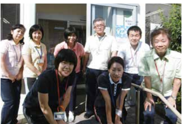
スタッフと木戸・大形圏域の高齢者のお手伝いをさせて頂いています