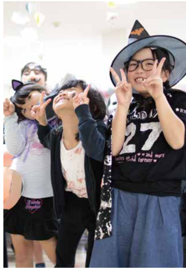
今年も学童クラブなじよもの子どもたちによるハロウィンイベントが開催され、各事業所の利用者さんたちとの交流がありました。10月30日、老健ほほえみの里まで