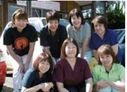
経験豊富な看護師が皆様の生活を支援します