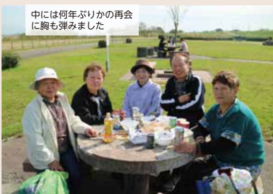
中には何年ぶりの再会に胸も弾きました

どちらも「愛情たっぷり」という名の汁を入れ一生懸命作ったら、押すな押すの長蛇の列となり、あっという間に完売してしまいました。