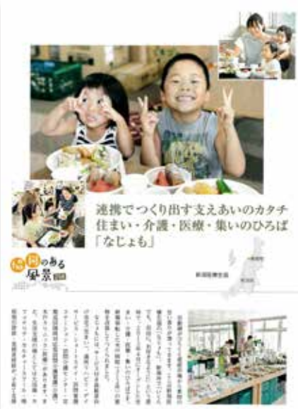
医療福祉生協の情報誌COMCOM(コムコム)11月号においても「なじよも」が特集され、地域のお年寄りの方々や働き盛りの親、その子どもたちの話題にも触れています