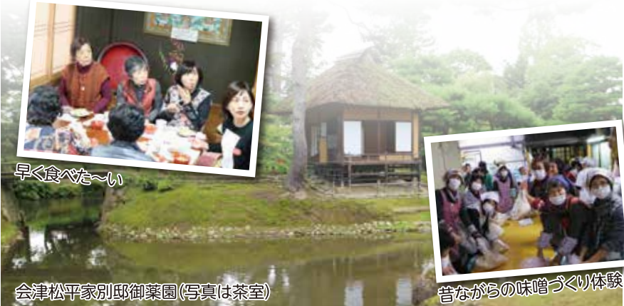
会津松平家別邸御薬園(写真は茶室)

しい心尽くしでした。自分で作った味噌が食べられるまで約半年。参加された皆さんは満足げに帰路に就きました。