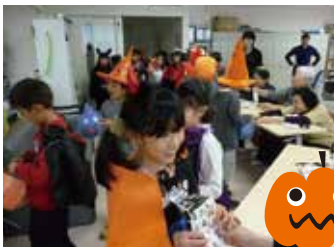
今年はずいぶん前から飛び出し「老健ほほえみの里きど」「院内保育所いちご畑」「特養あしめま荘」にも行って来ました