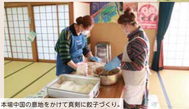
本場中国の意地をかけて真剣に餃子づくり。当日は9時に本所へ集合だったのですが、実は4時から始めていました。

前日までに材料の買い出しを行い、調理は朝9時に本所自治会館へ集まり、いも類・白菜・玉ねぎのきざみ、野菜の下処理が出来上がったなら河川敷に軽トラで運びます。