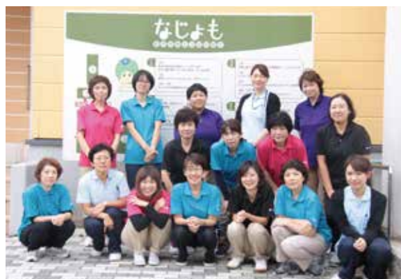
地域のみなさんに寄り添い充実した在宅療養ができるようサポートします

訪問看護の事例をご紹介します。80歳代女性が大腸癌肝臓転移にて木戸病院へ入院しました。終末期の状態であり娘さんは「在宅で母を看取りたい」と希望されました。しかし介護経験がなく、相談する人もないため「どこまでできるかやってみないと分からない」と不安・焦りでいっぱいになり訪問看護へ相談がありました。娘さんは職場の介護休暇をもらい、週1回の往診、週2回の訪問看護、1日3回のヘルパーが入ることでの患者さんの苦痛が軽減し介護者である娘さんの負担と不安が軽減できるようにつとめました。はじめは食事が摂取できていませんでしたが次第に食べられるようになり、娘さんは不安を抱くようになりました。主治医・娘さん・看護師で話し合い、看取りとはいえ何もしないではなく、食事ができない時に点滴注射を行うといった方法をとることにしました。週に1、2回の点滴をすることで顔色が回復し低下した意識が少し回復することで娘さんは安心できました。退院から約1ヶ月、本当に安らかな表情で旅立たれ「みんなに来てくれた。食事介助・口腔ケア・清潔援助など介護指導していく中でお互いの良い関係性も構築することが出来ました。」