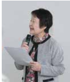
曾野木総支部は地域の人の健康、幸せづくりの観点から「結いの里」をつくりました

「医療・介護・暮らしのネットワーク」の構築には、我々の働く職場での多職種での交流の重要性がより一層増し、今現在組合員数が4万3000人を超えたが、今後成長していくには、「地域の思い」と「働いている職員の思い」をひとつにまとめてあげていくことが重要であり、それは困難なこと