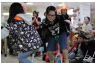
得意の「一輪車」も披露しました(老健ほほえみの里きど)

ちにも負けないくらい衣装の着た利用者さんや職員さんもいて、なじよも全体がお化け屋敷!?となりました。 なじよも内でこのような取り組みをすることによって、お菓子をもらえるだけでなく、介護施設について・医療や介護の職業について・様々な経験と知識を得てくれると信じています。そして、心豊かな子どもたちが地域をあたためてくれると願っています。