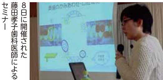
8日に開催された藤田孝子歯科医師によるセミナー