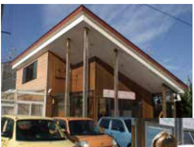
くすりのコダマはなみすき店の隣が事務所です

指定老人訪問看護ステーションあしぬまは、看護師7名と事務員1名が在籍しています。現在約60名のご利用者さんのご自宅に訪問しています。訪問看護とは看護師がご自宅に訪問をして、体調を確認したり医療処置を行ったりするサービスです。ご利用者さん一人ひとりの、病気や家庭環境が違ってあり、その状況に合った看護を提供できるように、安心して自宅で過ごすことができるように