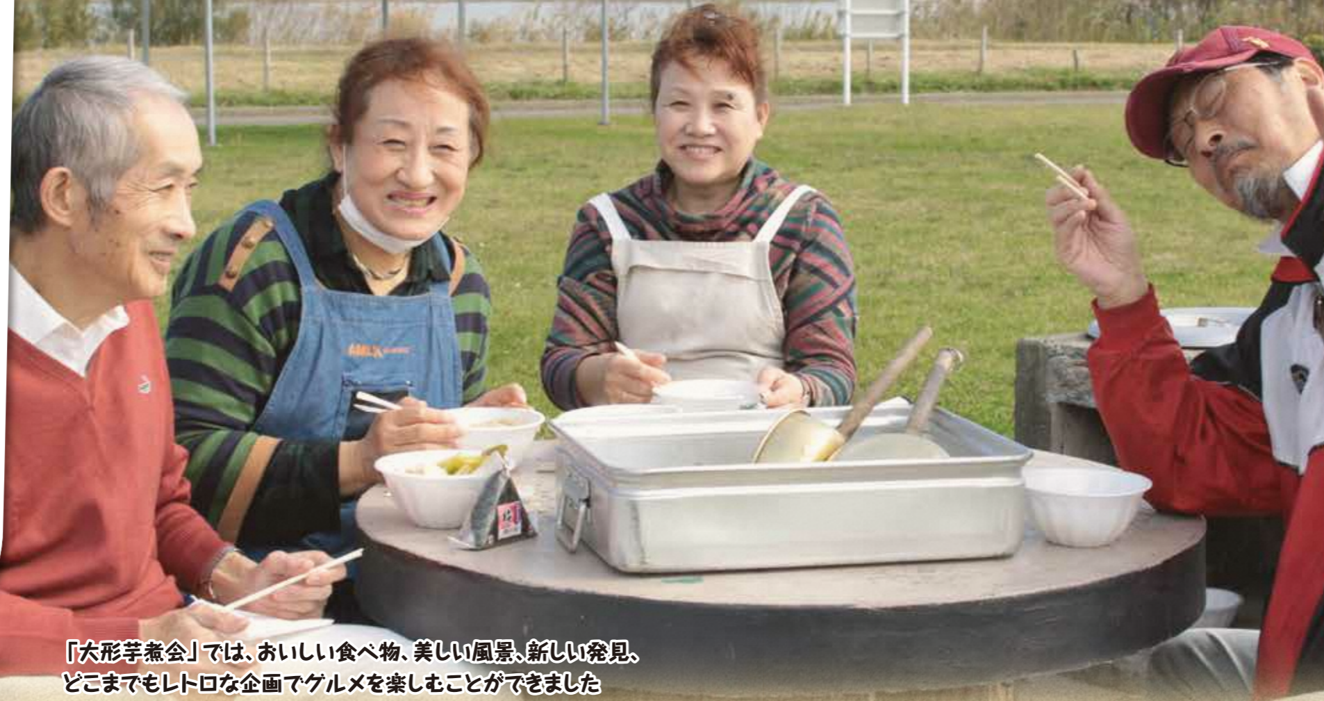
「大形芋煮会」では、おいしい食べ物、美しい風景、新しい発見、どこまでもレトロな企画でグルメを楽しむことができました = 10月27日、阿賀野川河川敷パーベキューエリア