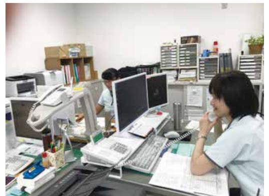
事業所の風景です