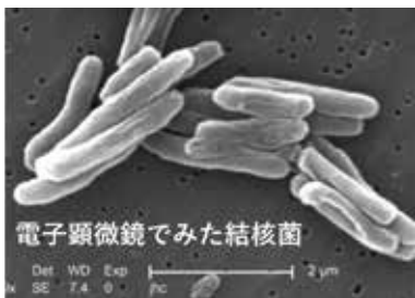
電子顕微鏡でみた結核菌