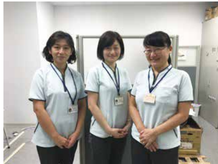
3名のケアマネジャーが勤務しています

80代の女性は、70代の妹さんと2人暮らしをされていました。女性は寝たきりの状態で、妹さんが介護をされていました。妹さんが認知症になり、介護がでなくなりました。更に妹さん自身にも介護が必要になりました。姉妹には介護協力をしてくれる親族がいません。女性の施設入所手続きをしようにも、判断能力が低下した妹さんでは身元保証人になれず、姉妹の生活が立ち行かなくなりました。 ケアマネジャーは、地域包括支援センター、主治医、保健師、区役所職員、サービス事業所など関係者と連携し、姉妹の成年後見制度利用手続きを行いました。その後、後見人が任命されて、女性は介護保険施設に入所、妹さんは介護保険サービスを利用しながら在宅生活を続けています。 最近、家族関係が希薄となり、介護保険サービスを利用するだけでは生活が成り立たない事例が増えていきます。これからの様々な職種と連携しながら支援を行っていききたいと思えます。