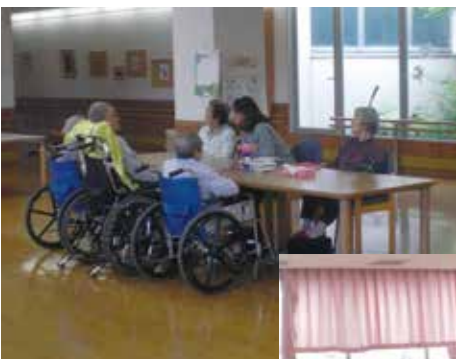
▲日中は広いスペースで過ごしていただけます

もおります。ここ数年の傾向としては家族構成の変化などもあり、以前よりも長期間の利用を希望される方が増えているように思います。ショートステイで過ごされる時間はご利用者の方々が歩んできた人生を思うと、とても短い時間なのかも知れませんが、これからも介護が必要な方々に選ばれる居場所の一つになるように取り組んでいきたいと思