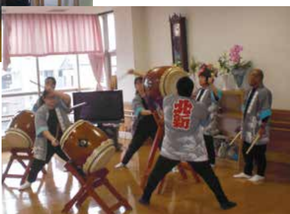
ボランティアの太鼓の演奏に盛り上がりました