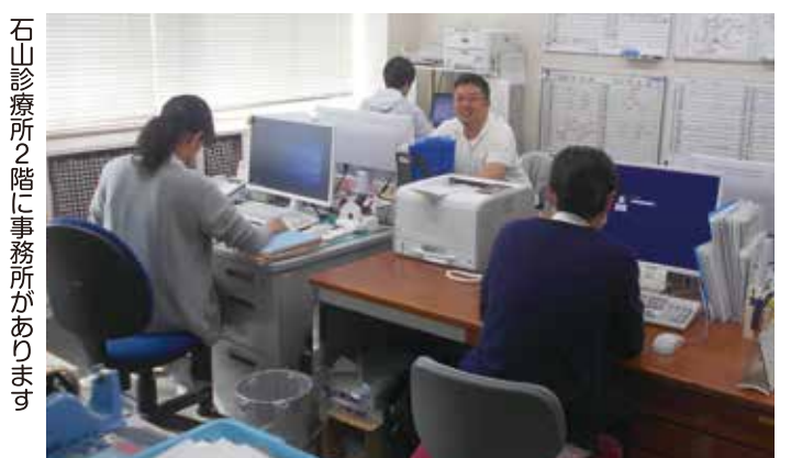
石山診療所2階に事務所があります

中には家族が海外在住のこともあり連絡が困難なこともあります。ひとり暮らしの方の支援で私たちが苦勞することは、サービスの同意や契約等の意思確認、医療との橋渡しなどです。たまに施設への引っ越しもあります。今後ますます多くなることなので私たちも学習して支援できる幅を広げていく必要があります。