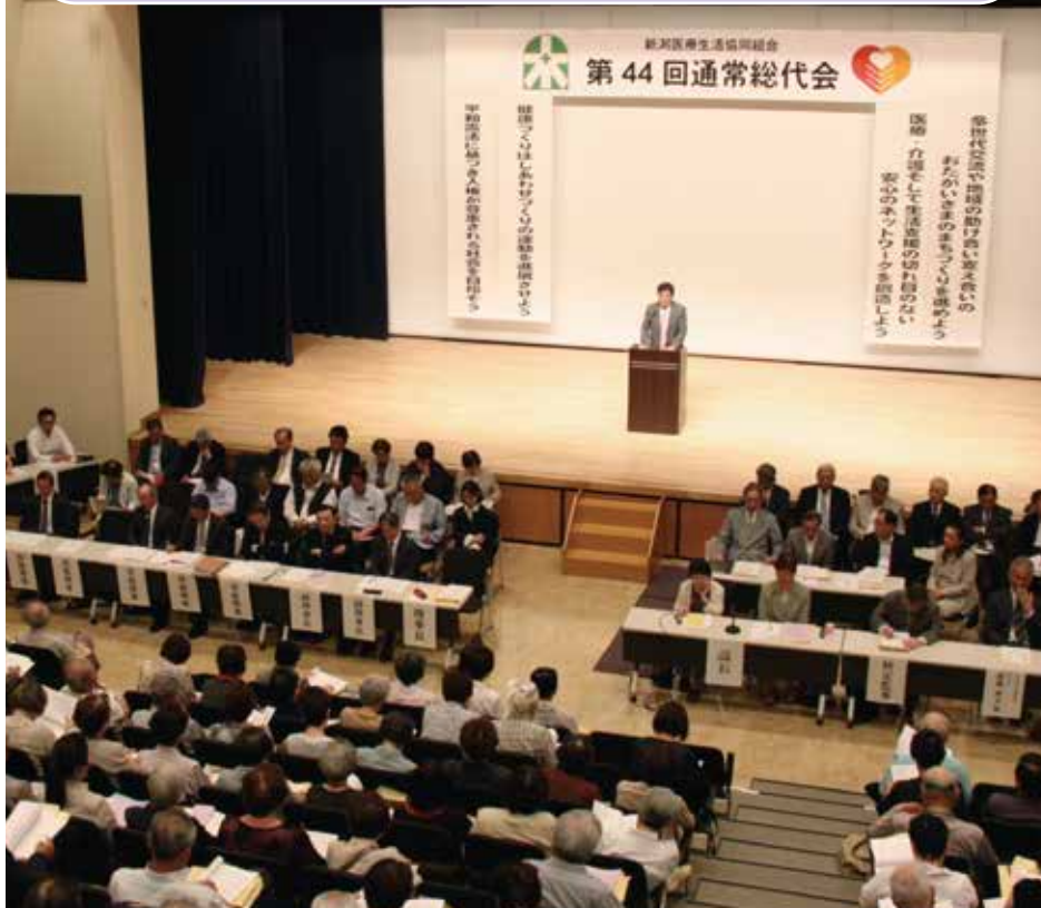
2018年度の総代会は「3つのつくる戦略」にもとづいて課題を整理し、実践していくことが確認されました