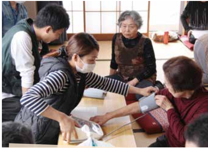
高齢者である組合員さん達が主体で活動しているような気がしました。皆さん、班会の中で日々の悩みや思いを言い合い、同じ悩みを共感したり励ましたりしているのが印象的でした。その中でリアルな思いを聞くこともでき、「高齢になっても、少しでも褒めてもらいたい」と言っていた事が心に残りました。

2018年度も多くの新人職員をむかえました。4月の研修では医療生協の基本理念、歴史、組合員の皆さんとのふれあいを学び、早速班会に参加しました。地域の公民館などで血圧を測り、対話し、多くの組合員さんから「がんばってね!」と声をかけられていました。