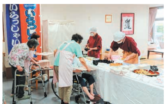
車いすの方もご自分で選びに来られます