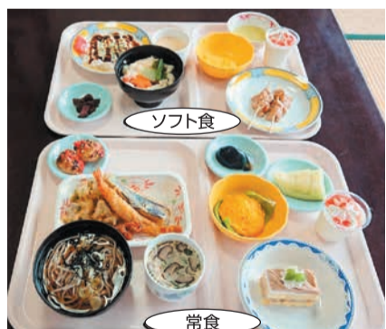
ソフト食と常食の盛り付け例