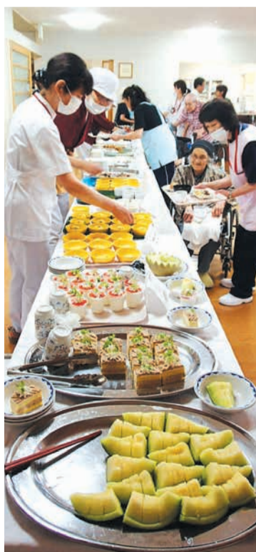
この中から好きなものを選んでいただきます