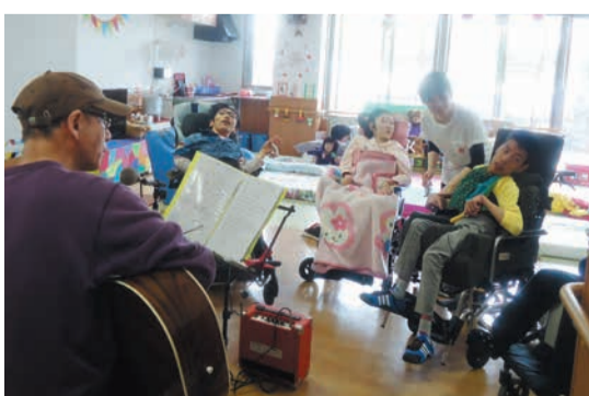
ギターと歌の楽しい時間