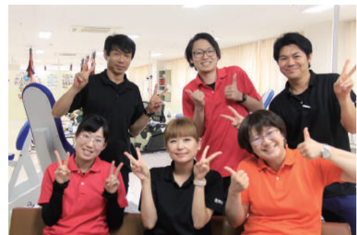
職員は相談員、理学療法士、介護福祉士、介護員で構成されています。

ここで一例を紹介いたします。脳梗塞後遺症により半身の麻痺(片麻痺)となり、通所リハビリの利用前は杖歩き、屋外では車いすを使用されていた方がいらっしゃいました。リハビリに通われた結果、現在では一人で杖なしで歩き、近隣のスーパーまで買い物に行っています。もちろん効果には個人差がありますが、この方にとって通所リハビリを利用されることは、「生活行動範囲を大きく広げる結果」となりました。