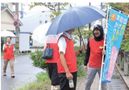
「出あい・助けあい・声かけあい」。3つの「あい」で安心して暮らせるまちづくり

また、重点課題のひとつである「医療、介護、くらし安心のネットワーク」として、(福)亀田郷芦沼会とともに「出」あひ「声」助