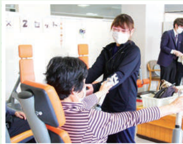
体験された皆さまにスタッフが丁寧に指導

いうちから体力・健康維持を心がけ介護予防に取り組みたい」といった思いを持ってもらえる事を改めて実感いたしました。 また、コープ健康づくりクラブWith(ウィズ)の会員さまも参加され、「やっぱり体を動かす事は大切ですね、早くWithが再開する事を待っています」といったご意見もいただきました。 これからも、楽しく気持ちよく過ごしてもらえる場所としてなじよもを選んでもらえるように努めていきます。