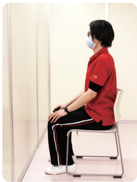
1. 壁を正面にして座ります。(壁が近くにない場合は、安定した台などを用いて行いましょう)