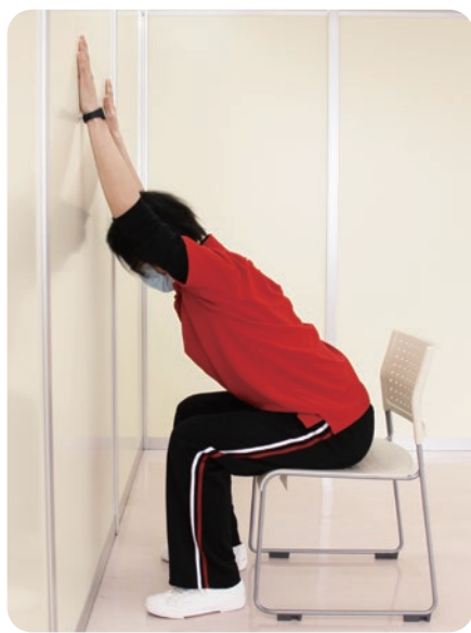
3. 肩が力まないように壁にもたれかかります。これを30秒を2回行います。