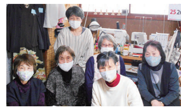
第1回目の開催を祝って記念撮影

大形総支部で新しい班会「小豆の会」が誕生しました。「小豆の会」という班名は、粒あんが好きな班員がいるということがきっかけとなり、小さな豆が集まってかたまつたように仲良く班会を行っていきたくという意味も込めて決めました。個性的で他の班会と被らない班名になったのではないかと思います。