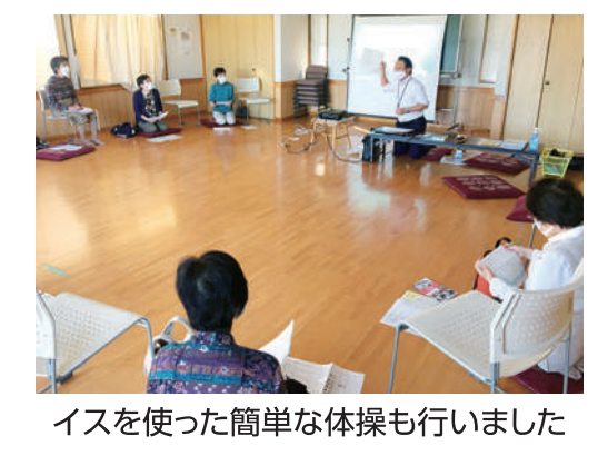
イスを使った簡単な体操も行いました

私たちの班会は毎月第三水曜日の午後開催していますが、新型コロナウイルス感染症の状況を見ながら実施を判断しています。最近中止することも多く、コロナ禍が一日でも早く終息することを願っています。少し前になりますが、「自らの心身機能を知る取り組み」として基本チェックリス