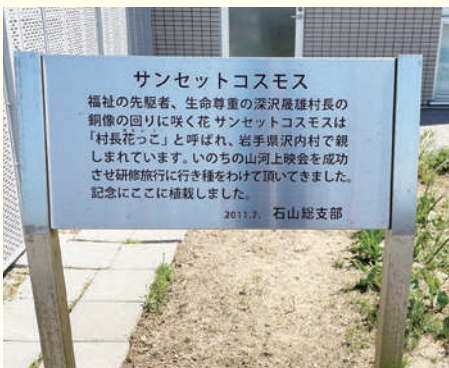
木戸病院の正面玄関わきの角に花壇があります