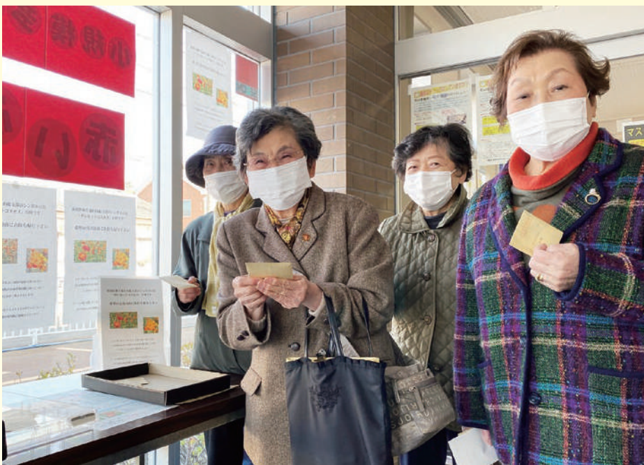
大勢の皆さんにサンセットコスモスの種を受け取っていただきました