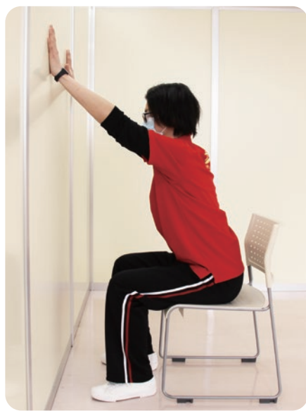
2. 両手を頭より上の壁につけ、背筋を伸ばします。