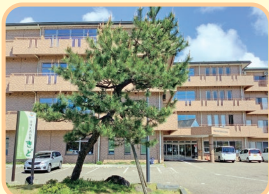
ほほえみの里きどはこんな感じの建物です。 立派な松と親切な職員が温かくお出迎えしますよ!