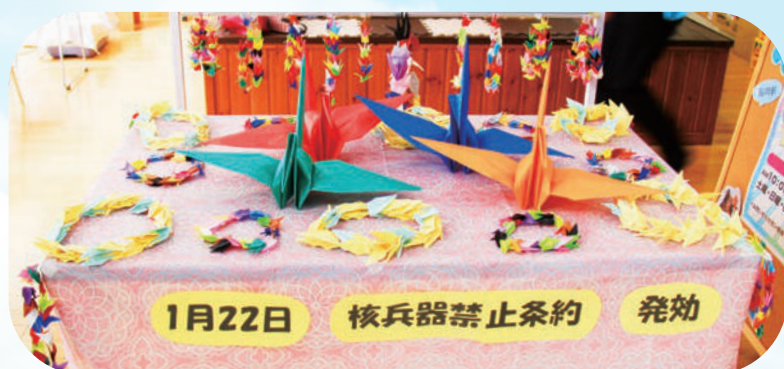
折り鶴に平和の願いを込めて

と一緒に、昨年鑑賞を呼びかけた映画『おかあさんの被爆ピアノ』から実際に被爆ピアノを呼んでのイベントを準備しています。昨年に続き「歩く」平和行進ではありませんが、コロナ禍の中で「歩かない」平和行進への活動の参加を募集します。(8月20日を予定日として準備中) また、今年も折り鶴の作成と8月6日の一斉黙祷の参加を呼びかけます。「一つひとつの小さな行動がたくさん集まり、大きな運動へとつながっている」この思いを胸に皆さまの参加をお願いいたします。平和への一歩を「一緒に」!