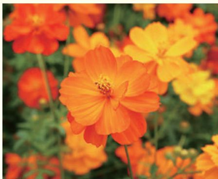
毎年きれいなサンセットコスモスが、たくさん咲きます

3月、石山総支部では、総支部の「シンボル」とも言われる「サンセットコスモス」の種を、石山診療所入口で、来院する方にお配りしました。今までは健康まつりや健康セミナーで配布を行っていたのですが、昨年度は感染症拡大のため行うことができませんでした。今年度こそは地域の皆さまへお配りし、きれいな花を咲かせてほしいという思いから、総支部で相談し、「石山だより」で地域へと呼びかけました。