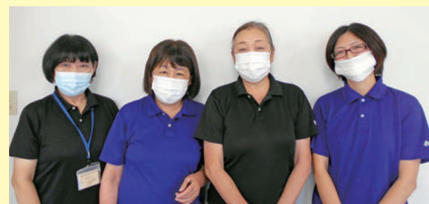
私たちの笑顔で皆さまの生活を支えます！

訪問介護センターなじよものヘルパーは、ご利用者さまの生活を支える縁の下の力持ちです。これからもヘルパーの明るい笑顔をお届けます。