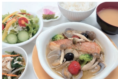
「地中海式和食」ランチ一例

日帰りドック利用の方への食事提供が既に始まっておりますが、一般の方もご利用可能ですので、是非新しいレストランでのメニューを一度ご賞味ください。