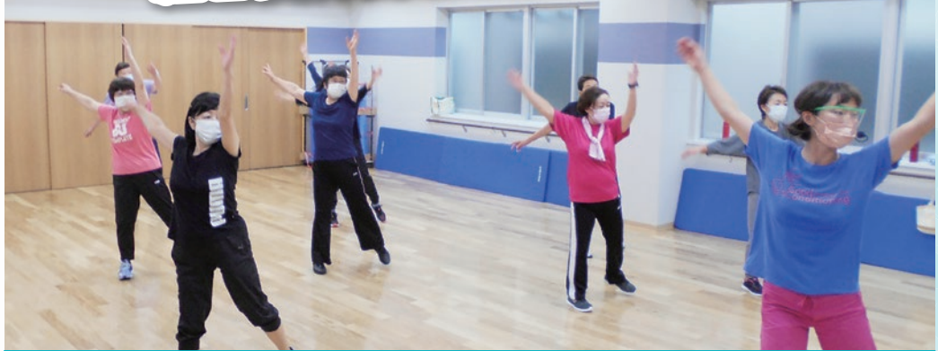
一例 スタジオプログラム 10月19日~24日 各回定員10名