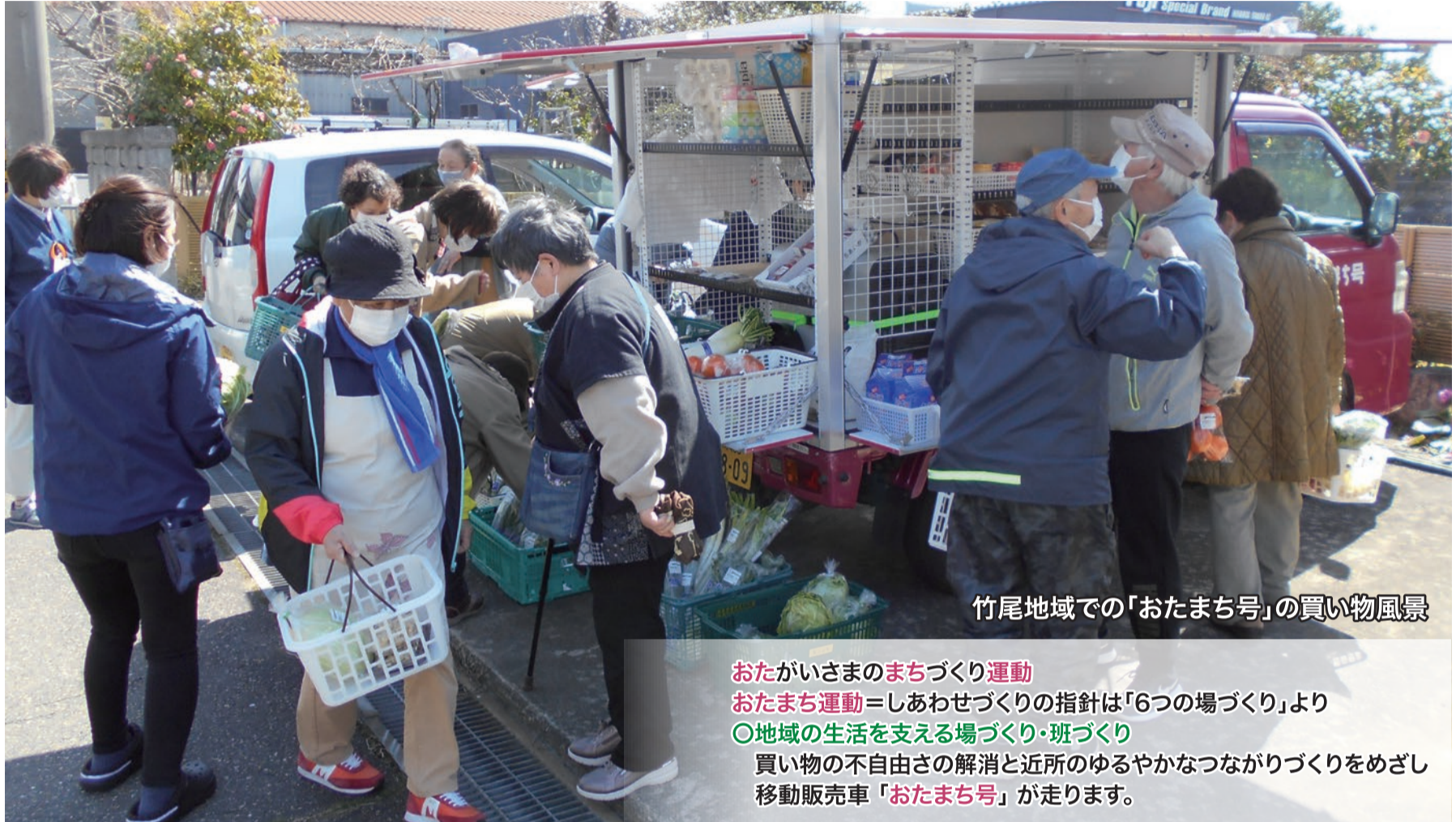
竹尾地域での「おたまち号」の買い物風景

おたがいさまのまちづくり運動 おたまち運動 =しあわせづくりの指針は「6つの場づくり」より ◎地域の生活を支える場づくり・班づくり 買い物の不自由さの解消と近所のゆるやかなつながりづくりをめざし 移動販売車「おたまち号」が走ります。