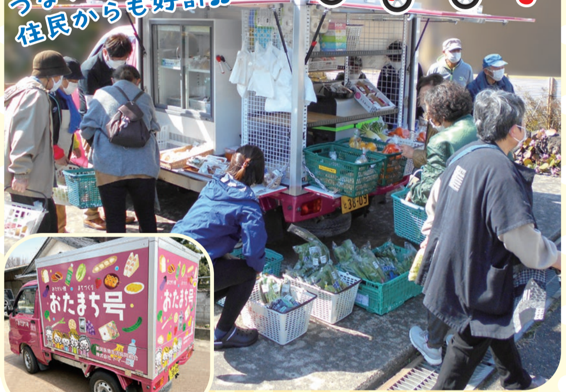
明るいピンクの車で 元気をお届けします!