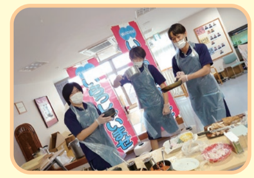
調理担当は元気いっぱいの男性スタッフ