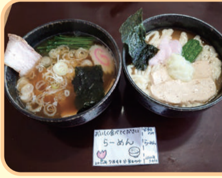
左は醤油ラーメン、右はソフト食醤油ラーメン

普段ソフト食やミキサー食の方には、厨房で麺や具をやわらかく加工し、汁にもとろみをつけて「ソフト食ラーメン」が完成！ 普段ほとんど食が進まない方も完食して下さったり、早くも「またやって欲しい！」とリクエストがあったり、ご利用者さまも職員も笑顔でいっぱい！大好評のラーメン屋さんでした。