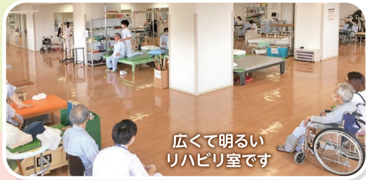
広くて明るいリハビリ室です