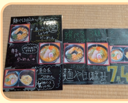
メニュー表も介護士の手作りです！