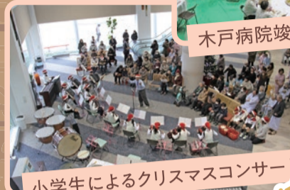
小学生によるクリスマスコンサート