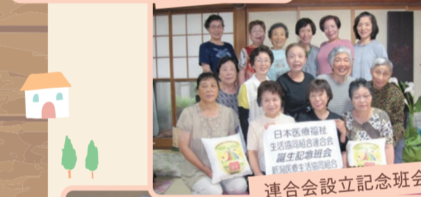
連合会設立記念班会