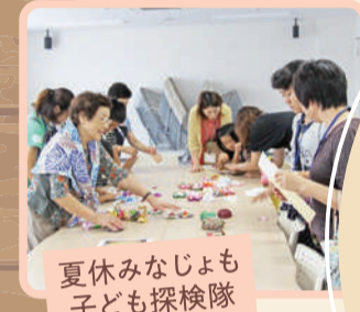
夏休みなじよも子ども探検隊