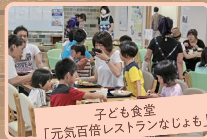
子ども食堂「元気百倍レストランなじよも」