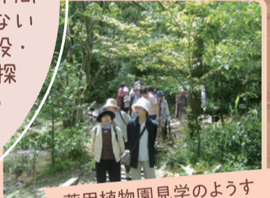
薬用植物園見学のようす

提携店などと連携した班会開催や、芸術や歴史などを趣味とする仲間と、一人だと、なかなか足が向かない美術館・博物館・史跡などの施設・地域を探訪します。セミナーや、探訪の後はワイワイ楽しく語り合うことを目指します。