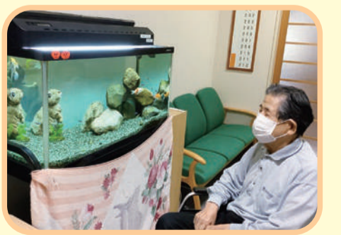
お魚見物の特等席! お気に入りの場所です♡