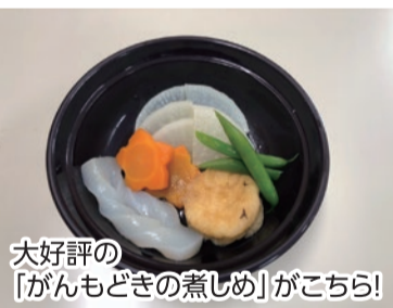
大好評の「がんとどきの煮しめ」がこちら!

昨年度の保健委員基礎講座では、アフター研修として「すこしお料理教室」を開催し、八方だしのとり方を学びました。ダシを効かせて塩分を減らし、旨味の効いた煮ものづくりに挑戦!参加者をご家庭に持ち帰ったところ、家族からも大絶賛の出来上がりでした。