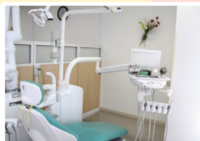
明るく清潔感のある診療室です