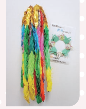
2020ピースアクション作成の折り鶴

みんなで作った折り鶴は、来年のピースアクションの取り組みの際に千羽鶴につなげ、広島市の平和記念公園の「原爆の子の像」に捧げることを目標とします。