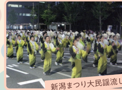
新潟まつり大民謡流し