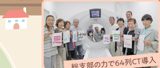
総支部の力で64列CT導入