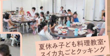
夏休みなじよも料理教室・スイカ丸ごとクッキング