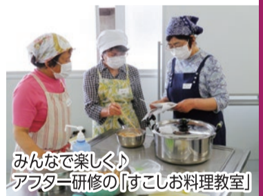
みんなで楽しくアフター研修の「すこしお料理教室」

受講後もみんなで学び続けたり、ヘルスローカスwithで運動したり(受講生は保健委員価格3,278円<税込>でご利用可能です!)、様々な活動を行っています。