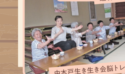
中木戸生き生き会脳トレ