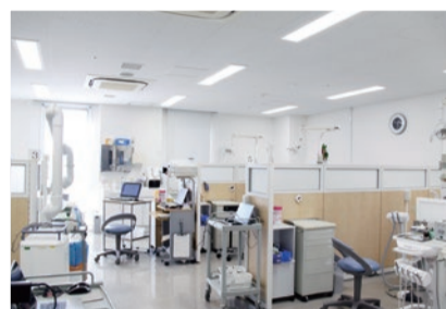
「歯医者さんはニガテ…」という方もお待ちしております😊