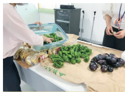
缶詰やカップ麺の他野菜も配られました

また、同日には調査も行いました。その結果、高齢の独居の方や、二人暮らしの方が多くといった地域の特性を見つかることもでき、今後の曾野木地区での活動の足がかりとなる発見があったと思っています。