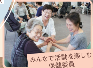
みんなで活動を楽しむ保健委員