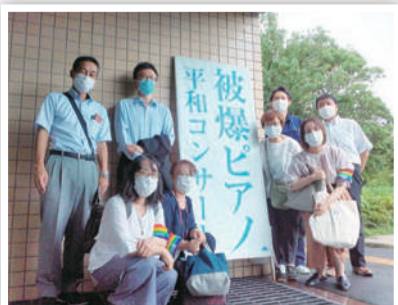
平和のありがたみを皆で実感しました