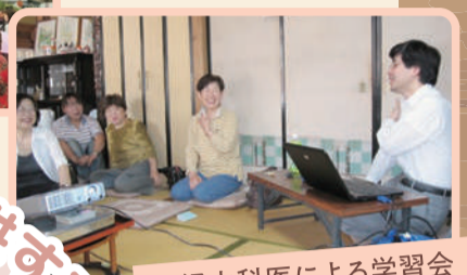
神経内科医による学習会