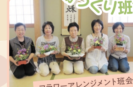
フラワーアレンジメント班会