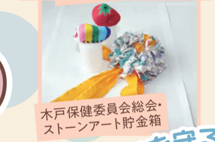
木戸保健委員会総会・ストーンアート貯金箱