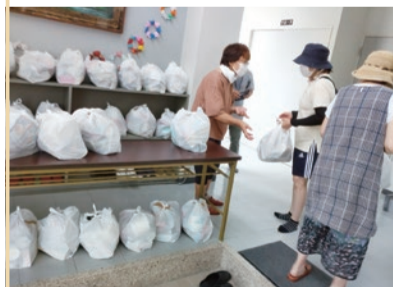
結いの郷で30人分、曾野木コミュニティセンターでは70人分を配布しました