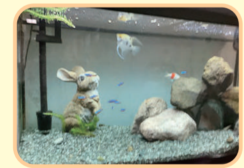
優雅に泳ぐ魚たちは、ほほえみ2階のスターです☆

今は大型行事・体操等レクリエーションが行えていない状態ですが、感染対策に注意し、密にならない個別レクリエーションを行う等の工夫をしながら対応しています。ご利用者さま・職員共に元気にコロナを乗り越えましょう!!!