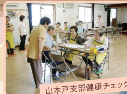
山木戸支部健康チェック