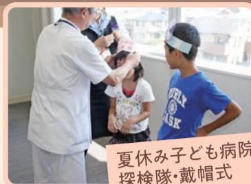
夏休みなじよも病院探検隊・戴帽式