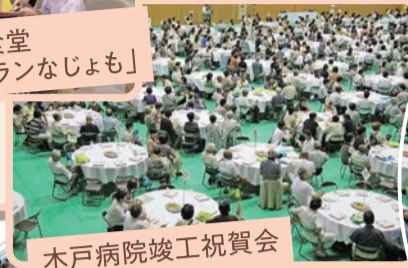
木戸病院竣工祝賀会