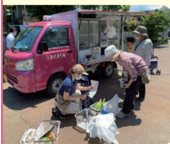
移動販売車「おたまち号」でのお買い物の様子です

実際はどんな活動をしているのか分からないことも、実践発表会を通して組合員さんといっしょに理解を深めるよい機会となりました。今後もさらに新潟医療生活協同組合を盛り上げていけるよう活動してまいります。