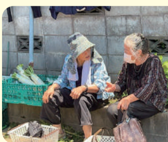
買い物ついでにおしゃべり♪