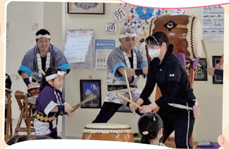
なじよも「秋まつり」開催 なじよもの祭りの特徴である“手作り”子ども神輿も繰り出し、楽しい祭りでした。