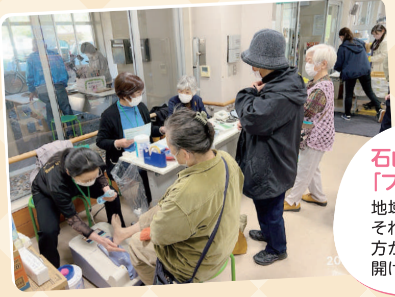
石山保健員会「フレイルまちかど健康チェック」 地域の文化祭でフレイル健康チェックを実施。それまでペットボトルの蓋が開けられなかった方が、これを機会にトレーニング。今では楽に開けられるようになったと報告がありました。