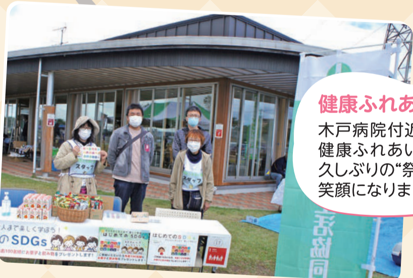
健康ふれあい祭 木戸病院付近の公園にて健康ふれあい祭を開催。久しぶりの“祭”でみんなが笑顔になりました。