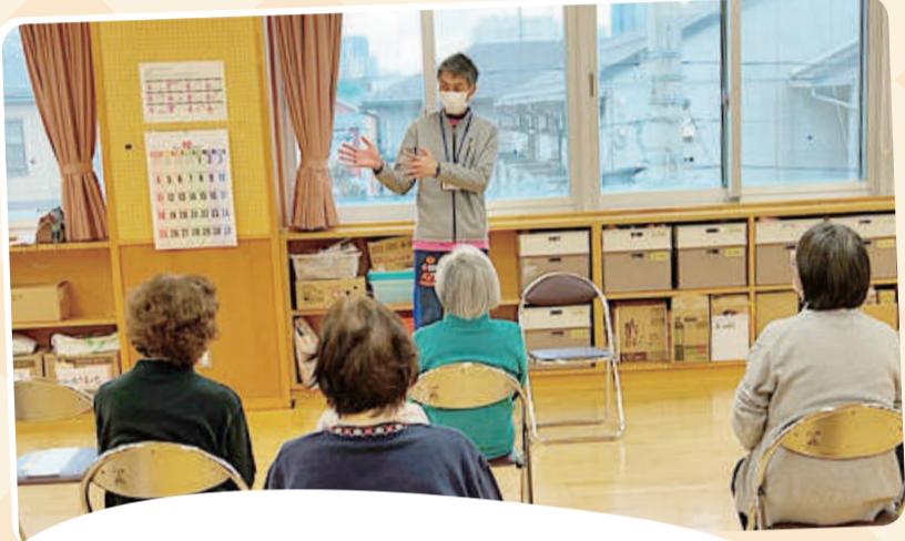
沼垂総支部健康セミナー「体操教室」 元気な参加者からは「毎月行ってほしい」と要望の声も上がり、班会立ち上げ秒読みかもしれません。