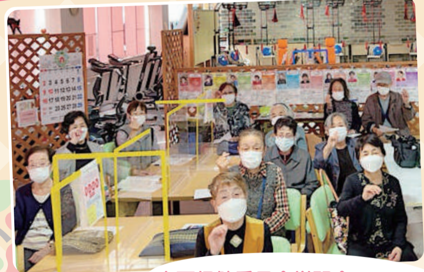
木戸保健委員会学習会「オーラルフレイルweb研修会」 歯科医師の話に耳を傾け、楽しく学びました。舌の動きについて学んだことを集まりの場で共有する場面も見受けられ、オーラルフレイルが徐々に広がりそうな予感がします。