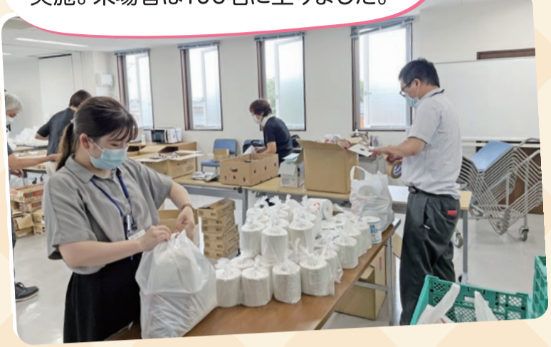
おすそわけプロジェクト 地域住民や団体から食品を寄贈していただき、必要な方に配布する取り組みを実施。来場者は106名に上りました。