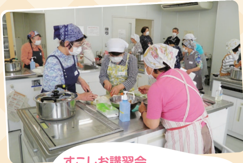
すこしお講習会 八方出汁を使った料理を作りました。今回は趣向を変えて料理はお持ち帰り。ご家族からは美味しい!の声が聞かれとても好評でした!