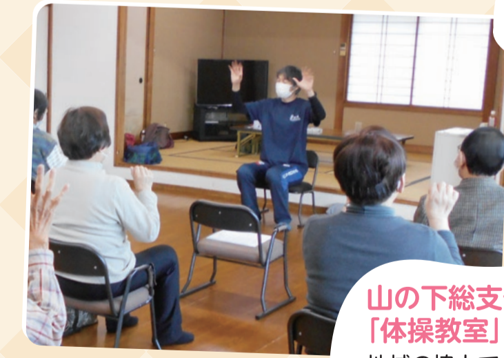
山の下総支部健康セミナー「体操教室」 地域の協力で、回覧板で呼びかけていただき、生協の活動参加が初めての方にたくさん来場いただきました。