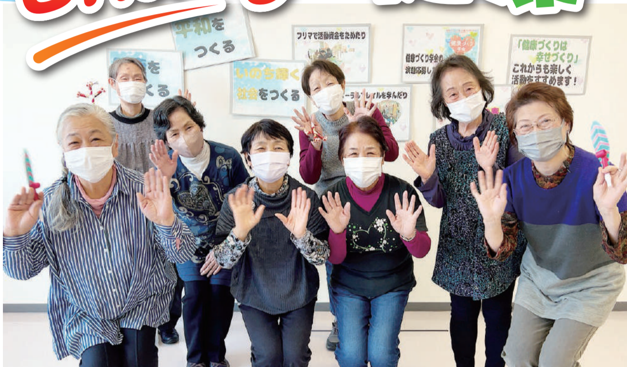
2030ビジョン学習会で、フレイル・オーラルフレイルの体操を発表した時の様子(木戸保健委員会)