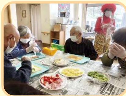
お好みのフルーツを乗せて…皆で恵方巻ロールケーキ作り★