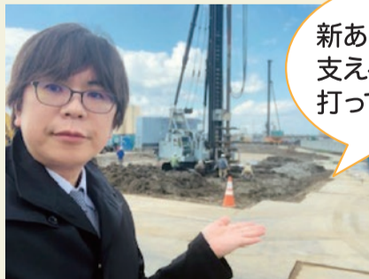
新あしぬま荘を支える杭を打っています。

人と人が関わり支え合い、得るもの、失うもので織り成される人生。介護からも得られる人生の豊かさを、心で感じ続けたい。私たちは大切な人を介護しながら、実はいつか必ず訪れる自身の老いの生き方を見つめ、学んでいます。その見つめる先が陽だまりであることを願います。