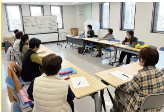
保健委員会会長会議拡大 健康ステーション会議の様子