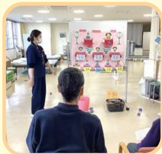
レクリエーションで楽しいひな祭り♪