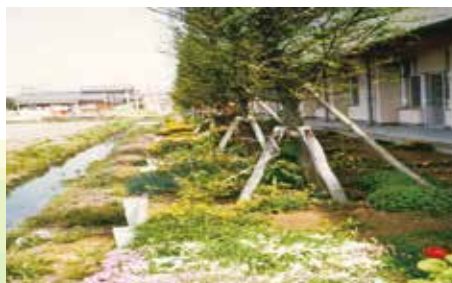
42年前のあしぬま荘西側庭と田園風景

風景が広がっています。この閑静な地で、42年前もそうであったように皆さまの手をお借りしながら地域に根差した施設になりたいと思っています。