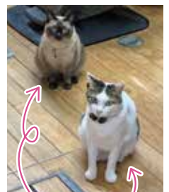
ちゃちゃとしんとです