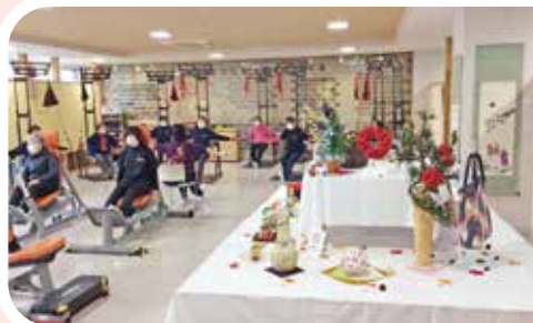
作品展を開催！ 作品の奥ではレッドコードを使ったストレッチ

百の花なじよもは、半日型の通所型基準緩和サービスとして月曜日から金曜日に営業しています。また月曜日から水曜日の午後は、江南区曾野木地区の結いの郷においてもサテライト事業所(出張所)として開設しています。