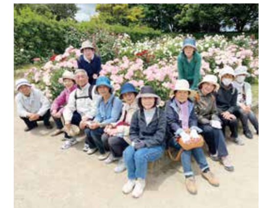
笑顔とバラが満開です!

の分まで満喫することができました。また、参加者から「歩くことに不安があったけれど、今日楽しく歩くことができて自信が ついた」