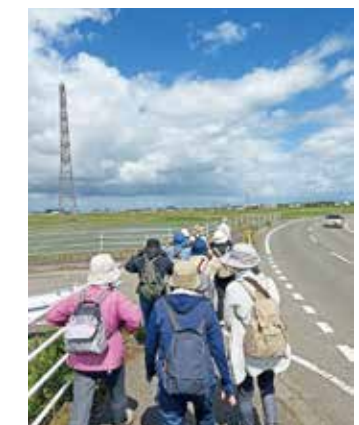
田んぼ道、意外と風強いです!

今年も濁川公園までウォーキングを楽しみました。前回開催したのが好評だったのか、昨年よりも参加者が増えました! 昨年は、ほとんど咲いていないと観ることができなかったバラ園ですが、今年は満開のバラが咲き誇り、あたり一面バラの香りに包まれていました。バラと一言で言っても「色」「花形」「香り」は様々で、初めて見る品種もあり、昨年