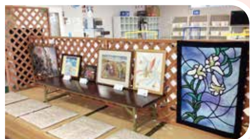
ご利用者さまのすてきな作品を展示しました

介護予防に積極的に取り組む事業所で、ご利用者さまは比較のお元気な方が多く、事業対象者が要支援の認定を受けた方が週に1~2回通ってこられます。運動での機能訓練が中心で、特にレッドコードでのストレッチがご利用者さまから好評です。それ以外にも、産直市場なじよもでのお買い物やなじよもの湯への入浴も楽しめます。