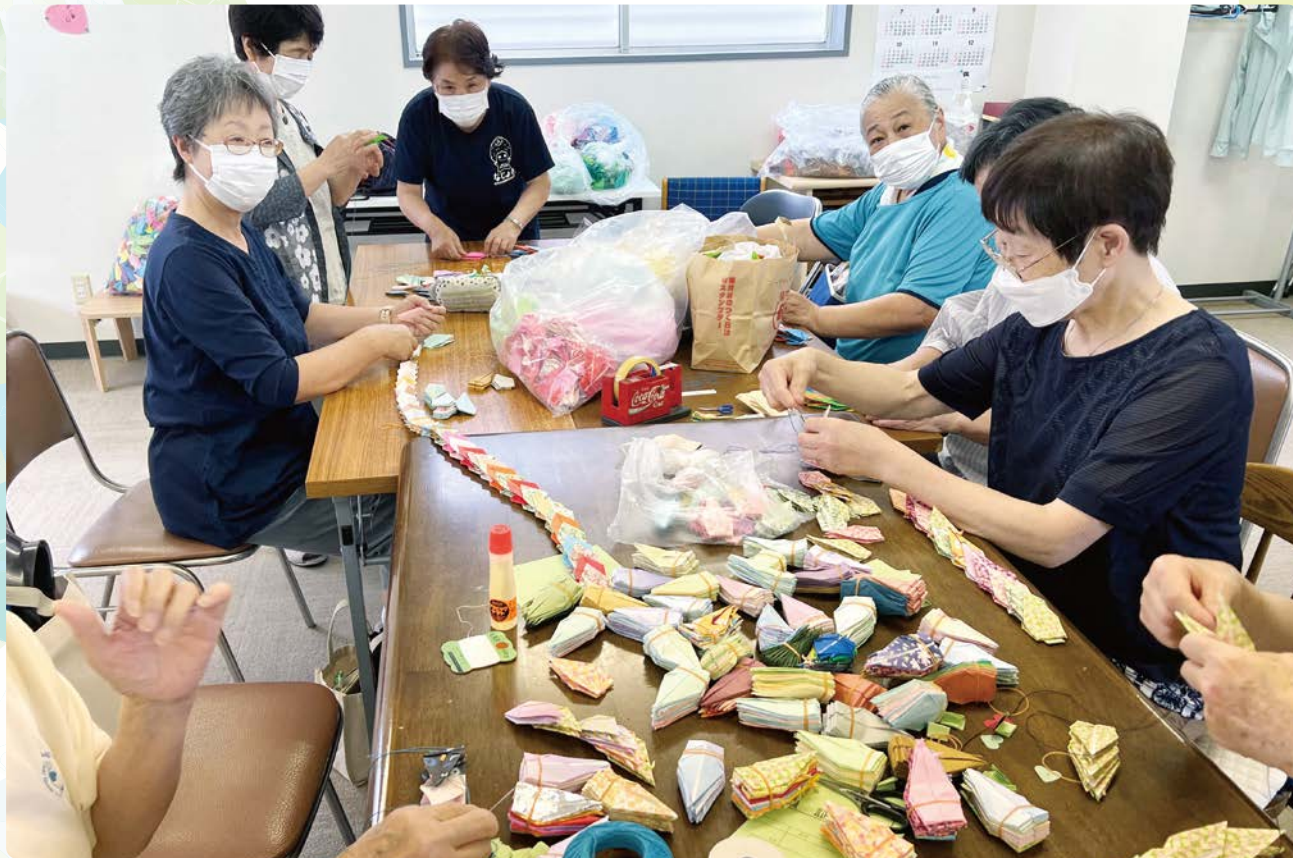
保健委員会では、折り鶴をつなぎ、平和について語りあいました。