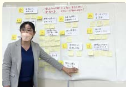
出された意見を全員で共有中