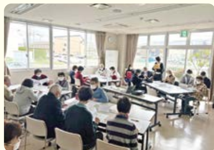
会場いっぱい参加者

第2回は12月22日(金) 13:30～を予定しております。ほかの医療生協の経験などに学び、支部が元気に活動するための「アイデア」を出し合います。