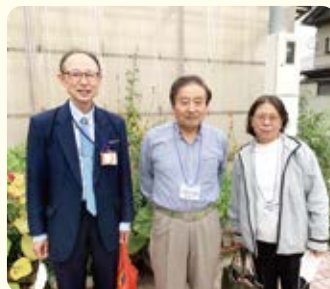
第4ブロック 対話行動