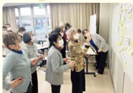
どこに投票しようか熟慮します