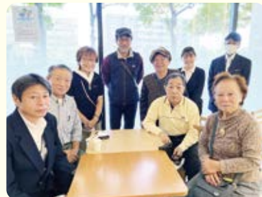
第2ブロック 訪問終了後