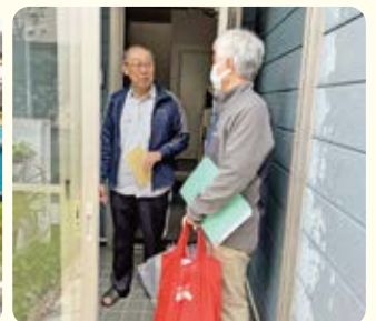
第6ブロック 訪問の様子