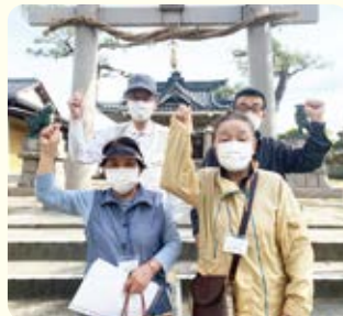
第1ブロック 対話行動

新潟医療生協では9月25日～11月30日の約2か月間、生協強化月間に取り組みました。一人暮らし高齢者世帯の増加、物価高騰による経済的負担の拡大など不安や問題がありますが、だからこそ協同の力で誰一人取り残さない「心やさしいまちづくり」をすすめています。コロナ禍で縮小していた対話行動を今年は大いに再開させ、各ブロックで取り組みました。また、生協強化月間スタート初日には全ブロックと各事業所をオンラインでつなぎ、つながりづくりや仲間ふやしの実践報告、生協強化月間中の計画などを発表し合う新しい試みをおこないました。その他にも「健康セミナー」や「各事業所まつり」など、参加して・学んで・楽しむイベントも開催しました。今後も対話を通じた「つながりづくり」と「まちづくり」を続けていきます!