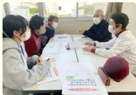
意見交換に熱が入ります