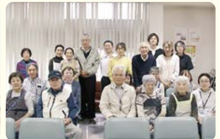
第3ブロック 石山診療所祭りでの集合写真