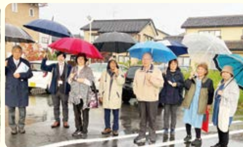
第5ブロック 対話行動