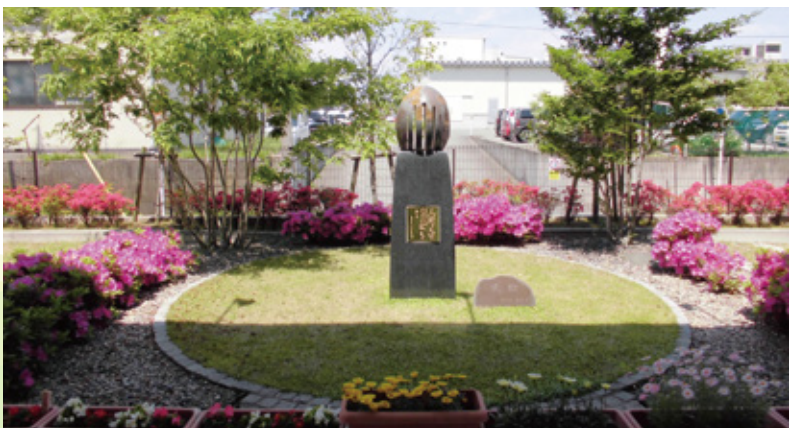
正面玄関モニュメント