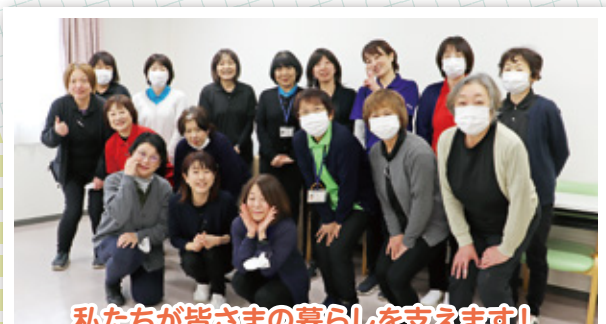
私たちが皆さまの暮らしを支えます！