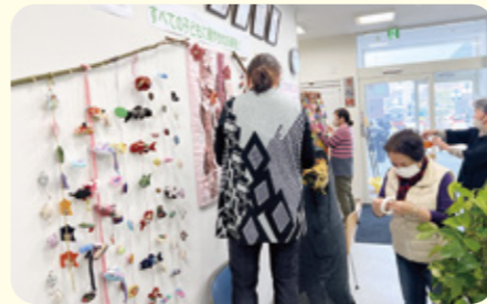
地域の皆さまが手作りをし、飾りました

木戸保健委員会と学童クラブなじよもの子どもたちが、国際協同年の取り組みのひ とつとして「さるぼづつるし雛」を作成し、地域活動部の事務所に飾り付けました。色と りどりの飾りが並ぶつるし雛は訪れる方々の目を引き、多くの人が足を止めて眺めてい ます。