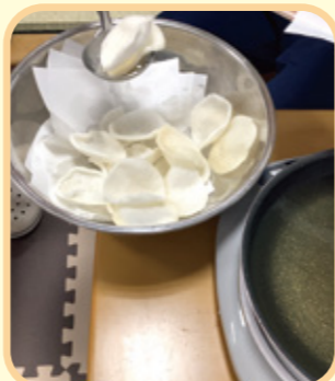
入所者さまの目の前で揚げ たてのせんべいを作りました

普段はあまり見かけないメンバ ーが集まり、ちょっと緊張感でした。 おいしいものを囲んで集まると自然 と会話が弾み、地域のお祭りのよう なにぎわいでした。また集まりまし うね！