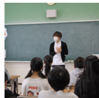
看護師よりAEDの説明