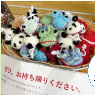
入居者さまが 製作するアクセサリー 北高校の女子高生界限で 大人気です