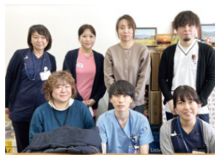
多職種で取り組みました