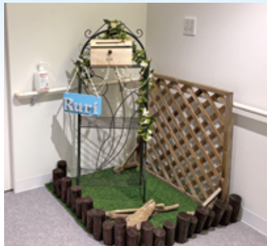
ユニットりの 洋風な玄関

あしぬま荘は家族を預ける、入所する施設ではなく、家族がその人らしい生活を継続するために入居する家です。