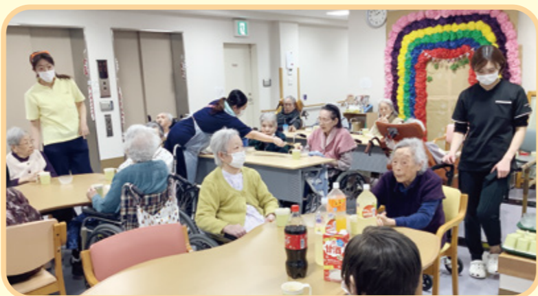
2階と3・4ユニットの個室入所者さまを一同に集めて、 楽しくいただきました