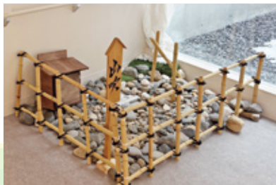
ユニットやまぶきの 和風な玄関