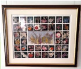
入居者さまが制作されました 自然をそこに閉じ込めた押し花アート