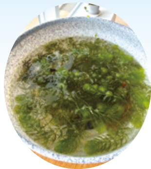
金魚を飼っている ユニットもあります