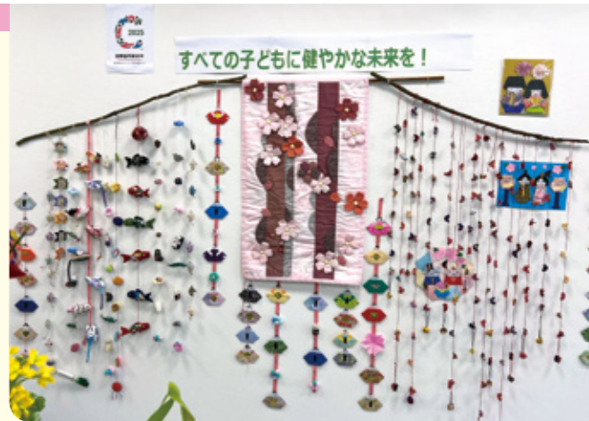
おたがいさまプラザに春がおとずれました

飾りには「健康」「幸福」「長寿」などを願 う縁起のよいモチーフもあしらわれ、風に 揺れるたびに温もりを感じさせます。手作 りならではの温かみが伝わるこのつるし雛 を、ぜひ地域活動部のおたがいさまプラザ でご覧ください。