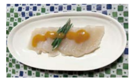
さしみこんにやく