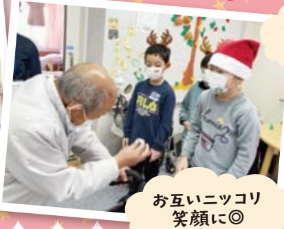
お互いニッコリ笑顔に◎