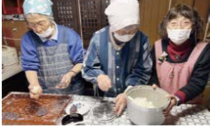
包む・測る・もる それぞれの役割で♥

で量りは使わなかったのですが、どうしても大きさにばらつきが出てしまうので、量りを使うことで、同じ大きさで、美しい、そして美味しいおはぎが完成です。お昼にみんなで楽しく頂き、一年を振り返りました。