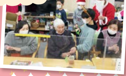
お一人お一人に渡していきます