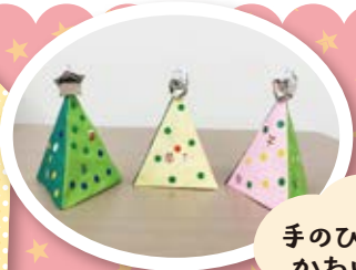
手のひらサイズのかわいいツリー