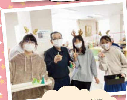
楽しいお昼の時間になりました♪