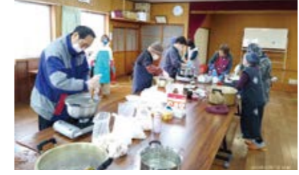
手作りこんにやくのコツはカブよくこねること!