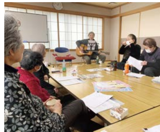
楽しく明るい声が響きました

コロナ禍で禁止だった会場での飲食が解禁となったので「くみつく」の提携店和縁さんのお弁当を注文。デザートはサビンの付いた美味しいお弁当を食しながら和やかに話が弾み、みんな満足でした。食後はギターの先生の伴奏に合わせて、懐メロの数々を出る声も出ない声(?)も張り上げて歌いました。「高校3年生」「瀬戸の花嫁」「人生いろいろ」「結婚しようよ」：次々と懐かしい曲を歌い、若い頃の思い出に浸ることができました。のびのびと声を出さず、歌う、という事はとても気持ち良かったです。また歌う新年会となりました。