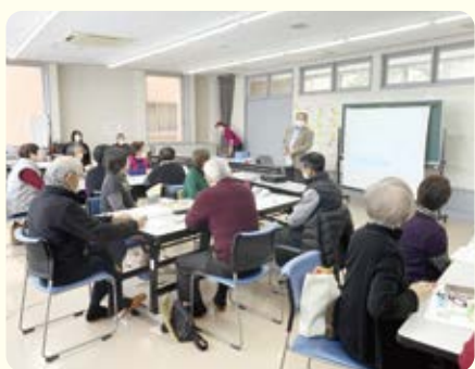
説明に真剣に耳を傾けている様子

「おたまちワークショップ」は、「おたがいさまのまちづくりを実現したい」「新潟医療生協の事業にもっと組合員さんに関わっていただきたい」という想いを実現するきっかけづくりとしてスタートしました。地域の組合員さんが主体となって支部を元気にする活動を考え、実現させるための取り組みです。