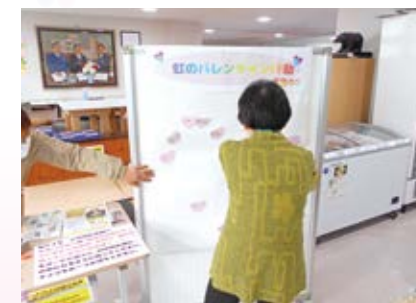
平和への願い、メッセージでハート形に