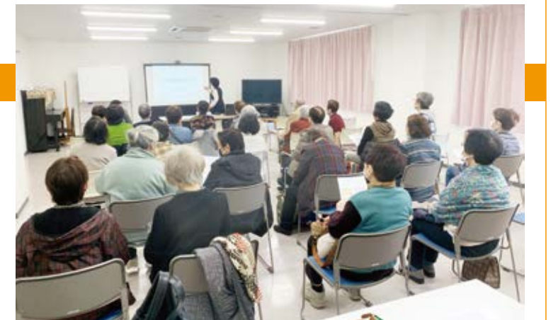
わかりやすい言葉でみんなうなづいている様子