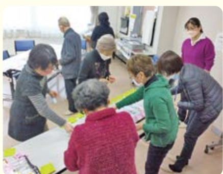
どれに投票しようか悩んでいる様子

参加した方からは「みんなと話せて楽しかった」「みんなのアイデアが参考になった」「組合員さんがますます元気で活動できるように期待!」「新しく加入した組合員さんに機関紙を届けたい」等の感想をいただきました。