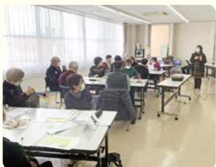
さまざまな意見があがりました

3グループに分かれて意見交換を行い、各自がアイデアをカードに書きだしました。その後、カードを読み上げ、似たようなアイデアを集めて模造紙に張り出し、グループにしてタイトルを付け「アイデア地図」を作成。「重要だ」「いいな」と思うタイトルに5点から1点までの持ち点で投票し、1位から10位までのアイデア順位を決めました。