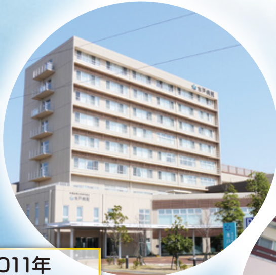
2011年 新木戸病院完成