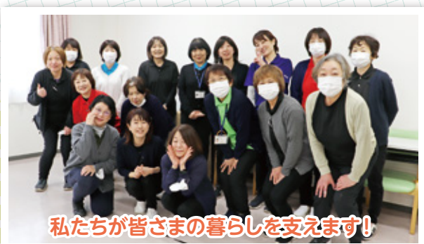
私たちが皆さまの暮らしを支えます!