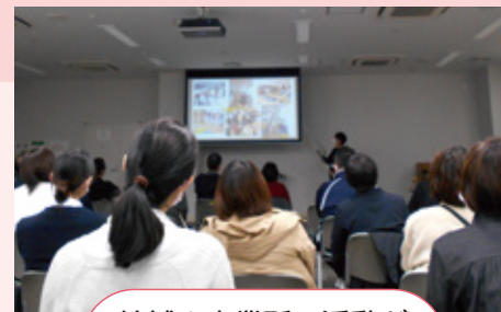
地域や事業所の活動が 良く分かる会でした!

新潟医療生協では、今後も医療福祉生協連「いのちの章典」に基づいた活動を、組合員・職員の皆さんに広く知っていただけるよう活動してまいります。