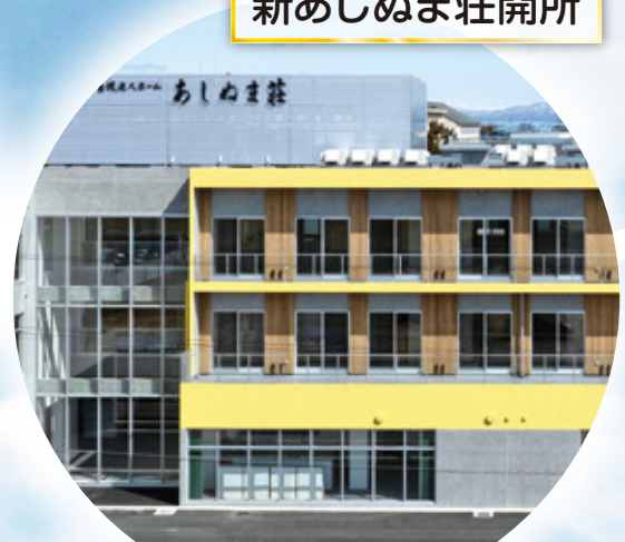
2024年 新あしぬま荘開所