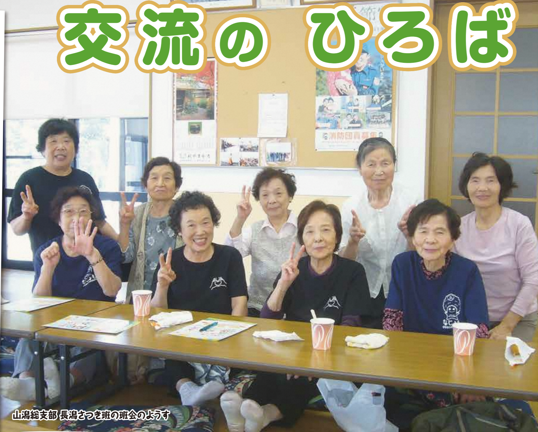
山潟総支部 長潟さつき班の班会の様子