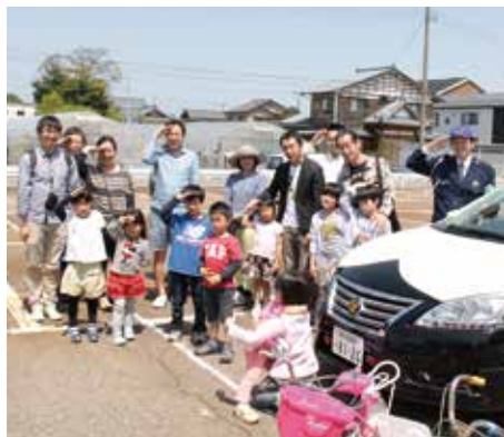
教室の最後にみんなで敬礼!!

参加した子どもたちから「事故にあわないように気を付けたい」「本物のパトカーに乗れて嬉しかった」といった感想や、親御さんからは「教室後、自転車に乗る時に左右確認をしっかりしている姿を見ると参加して良かった」といった感想をいただきました。今後も新潟医療生協では、地域の