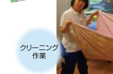
クリーニング作業