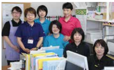
現在なじも2号館3階に事務所があります

訪問介護センターなじもは、この事例を通じ、個別支援の大切さ、専門職としてご家族さんの問題を捉え平穩になれるような関わりをもてたと感じました。これからも様々な対応を学んでいきながら利用者さんの支えになっていきたいと思います。