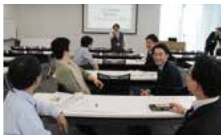
コープケアカレッジの池講師による認知症サポーター養成講座

また、今回の企画は同社の社員(新潟医療生協の組合員)が学童クラブなじよもを利用しており、その繋がりから実現されたものです。