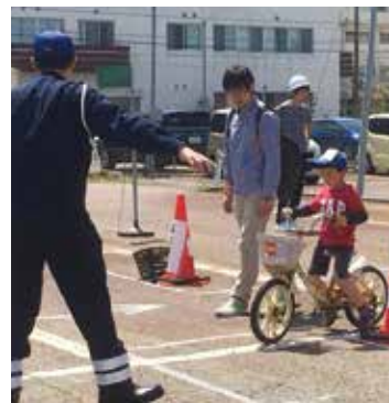
お巡りさんの指導を受けて「さあ出発!」