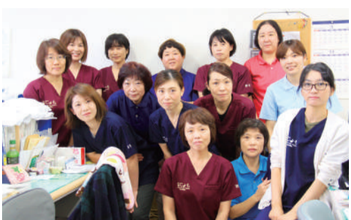
訪問看護ステーションのスタッフ(看護師、リハビリ、事務員のチームで日々の業務にあたっています)