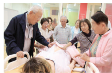
看護学科にある疑似患者ロボットはコンピュータ制御により涙を流すこともできます

上戸西支部は10月11日に「新潟医療福祉大学校内見学ツアー」を開催しました。この企画は以前に開催した新潟医療福祉大学との共同イベントの際、お誘いいただき実現したツアーです。当日は看護学科・義肢装具学科・社会福祉学科の3学科を見学させていただきました。その中で特に皆の注目を浴びたのが、看護学科にある「メデイカルシミュレーション教育センター」です。コンピュータ制御により、様々な症状をリアルに再現できる高性能シミュレータ(疑似患者ロボット)があり、実物のロボットに触れたり近くで見ることができました。