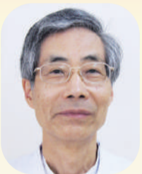
木戸クリニック 所長

ほほえみの里きどは開設16年目の年を迎えました。利用者の方々に安全と元気が出る介護・リハビリ・看護・医療を今まで以上に提供できるよう職員全員で工夫を重ねます。今年も、ほほえみの里きどと地域の絆をさらに強めたいと思います。地域にもっと当施設を知ってもらい、地域に役立つ活動を考えたいと思います。通所・入所ともに関連事業所との連携を強め利用者の確保に努めます。一定期間の入所で元気になって自宅等に戻り、また時期をみて入所する往復利用にも力を入れていきます。各部署の職員が互いに協力し業務を行っていますが、介護・看護の職員不足が続いており、今年補充されることを期待したい。多くの課題がありますが職員一同元気に日々活動していきます。