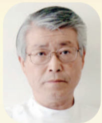
ほほえみの里きど 施設長