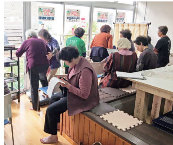
「なじよもでワンコイン健康チェック」