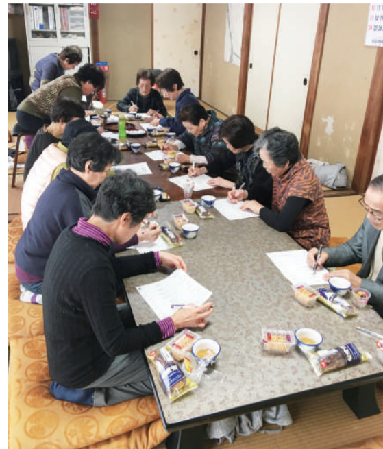
「班会をつくって、1年経ちました！」