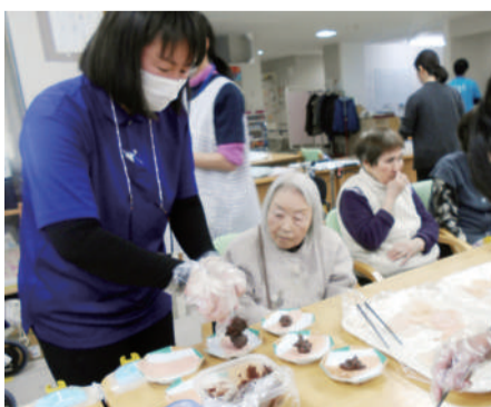
みんなで桜餅づくり

利用者さまには生地を混ぜ る・生地を焼く・飾りつけをす るお手伝いをして頂きとても楽 しい調理レクリエーションでし た。皆さまは「キレイだね。か わいいね」と話されとても喜ば れておりました。