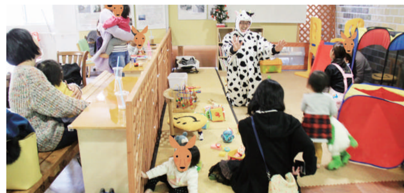
カンガルーカフェ(子育てサークル・カフェ)

子どもから高齢者まで、助け合い・支え合いの関係づくりの輪を広げます。また、楽しい取り組みをすすめます。