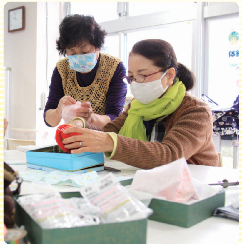
マスクつくりません課