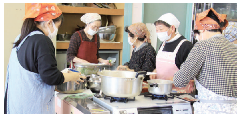
すこしお料理教室

健康で自分らしく、長生きしたいを実現するため、地域での健康づくりの輪を広げます。