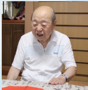
ご自宅で、日の丸の寄せ書きを前に当時を語ってくださいました

「出撃すれば、必ず戦死する」。もちろん、それはみんながわかっていた。実際、私の先陣の班はだれひとりとして帰って来ることがありませんでした。搭乗する飛行機には、必要とする燃料の半分も積まれていません。それは、太平洋上に敵艦を見つけた次第「突撃しろ」という意味でした。つまり「特攻隊」です。しかし、出撃の2日前の8月15日、日本の敗戦という形で終戦を迎えたのです。