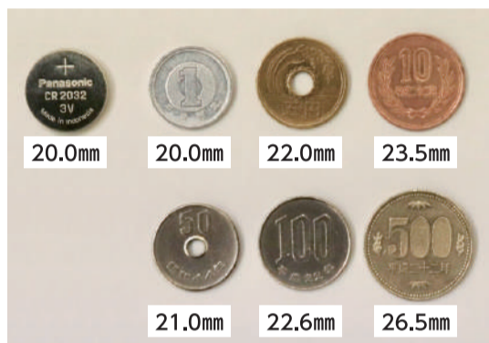
(図2) ボタン電池と硬貨

の手の届かないところに保管しましょう。気道異物の原因になることもある豆類を食べさせるときには小さく潰したりして飲み込みやすくしてあげると良いでしょう。