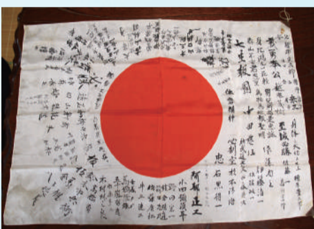
新潟医療生協では平和への願いを込めて、千羽鶴を作成

※1 第二次世界大戦時、ニューブリテン島(現在のパプアニューギニア)のラバウル基地に集結し、この空域に展開して戦闘に参加した、日本海軍・陸軍の各航空隊(航空部隊)の総称。