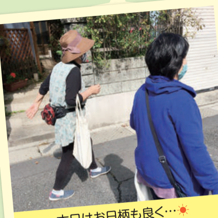
本日はお日柄も良く...ポストイン日和です!