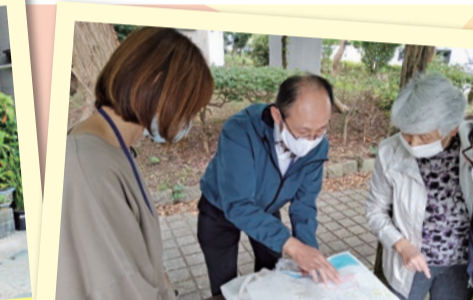
「今日配るエリアはこの辺ね。」地図を見ながら、みんなで投函する地区を確認します。

2020年度 生協組織強化月間 150名以上が新たに組合員さんになりました! つながりで健康づくり、しあわせづくりを一緒に!!