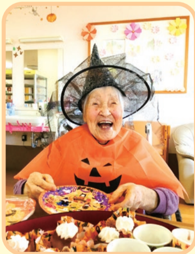
101歳の利用者さまもとってもステキな笑顔!

衣装や帽子を身に着けての記念撮影も行い、笑顔いっぱいのおやつバイキングとなりました。ほほえみの里きどでは、生活のほとんどを施設内で過ごす利用者の方へ少しでも季節を感じて頂けるよう、今後も工夫を凝らしたレクリエーションを行っていきます。