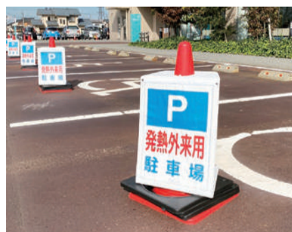
発熱外来の受診者用駐車場には三角コーンがごございます

問診よりインフルエンザや新型コロナウイルス感染症の疑いがあると医師が判断した場合、発熱者