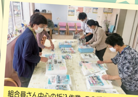
組合員さん中心の折込作業。この手作業を経て、皆さまのお宅にチラシが届けられるのです☆