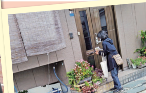
「一人でも多くの方が読んでくれますように...」思いを込めて、一軒一軒のお家へお届け。