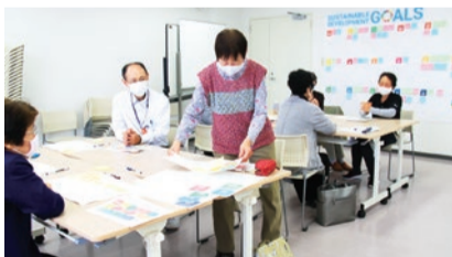
2020年10月、木戸保健委員会がグループワーク形式でSDGsを学びました

新潟医療生協が取り組んできた、地域に根ざした事業、組合員が地域で広げる健康づくり活動やまちづくりなどは、SDGsの視点ともつながります。医療・介護・福祉を柱とした「3.すべての人に健康と福祉を」はもとより、地域の班活動や子ども食堂などを通じて、SDGsの17の目標と数多く重なり合っています。仲間と一緒に日々の活動を振り返り、これら17の目標と照らし合わせることで、新しい気付きが生まれるかもしれません。そしてこれらを意識した活動を継続していくことが、SDGsのゴールへと近づきます。私たち一人ひとりが身近なことから考え、実行することが大切です。