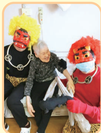
ふにゃふにゃの金棒を持った鬼とご利用者さま

2月3日、ほほえみの里きどでは節分の豆まきを行いました。今年1年健康で過ごして頂けるようお願いを込め、職員が鬼に扮し、ご利用者さまには豆をまいて頂きました。皆さんの反応は様々で、鬼に驚かれる方や、「ほら行くよ〜!」と笑顔で豆を投げられたり、「来たな! 退治してやる!」と意気込む方など、笑顔の絶えない節分となりました。豆まき後は、年の数だけ豆を食べる...とはいきませんでしたが、おやつに甘納豆を皆さんで召し上がりました。