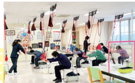
運動が苦手でも、スタッフが丁寧に説明します!

今後も、運動機器等を整備し多くの利用者さまの声にこたえていきます。百の花なじょもの体験会は今後も継続して開催し、次回の開催は4月24日(土)を予定しています。予約制となっており、50名の定員に達し次第締切らせていただきます。お気軽にお問い合わせください。