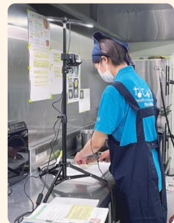
調理中はカメラで手元を撮影し、調理の様子をわかりやすくしました