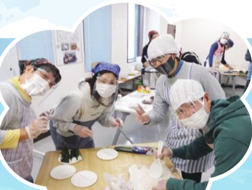
マスク・フェイスシールド・手袋 サバイバル飯炊き調理実習

学びを深め、 介護の質を高めています 新潟医療生協の介護福祉部では毎月学習のテーマを決め、介護職員研修に取り組み、2021年度2回目の介護職員研修(公共訓練卒業生7名を含む)講師を合わせ15名が授業に遊びに来ていただきました。 自己紹介の後、着脱の指導を実施。勤務先の事業所の話、授業の話、実習の話等、楽しい時間を過ごしました。公共訓練の受講生の感想は、卒業生と話すことで、介護の現場で働くことが実感として感じ取れたそうです。介護事業所の中で開校しているCOOPケアカレッジの強みが発揮されました。これからも先輩介護士の皆さんとの交流を大切に、楽しく、実りある授業に取り組んでいきたいと思えます。