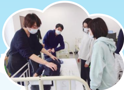
体位変換のコツを学んでいます