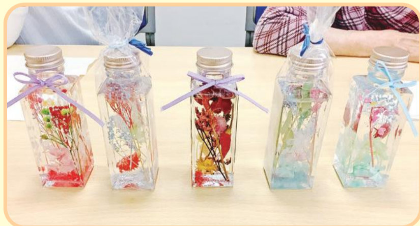
色とりどりのハーバリウム どれもキレイにできたね!

先日はハーバリウム作りをしました。事前に参加希望をと り、制作しました。参加されたご利用者さまは楽しそうに作 られており、完成されたハーバリウムを嬉しそうに見せてく れました。コロナ禍で外出レクが出来なくなりましたが、施 設内で楽しんで利用していただけるようにしています。