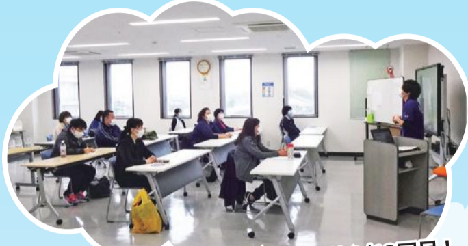
新潟医療生協 介護職員新人研修1/12回目!