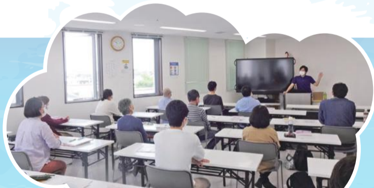
介護員養成科1ドキドキ 初めての授業