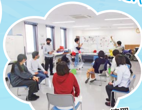
レクリエーション演習