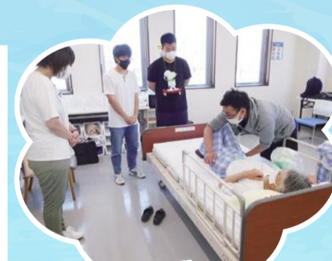
着脱・移動、 移乗技術を磨きます