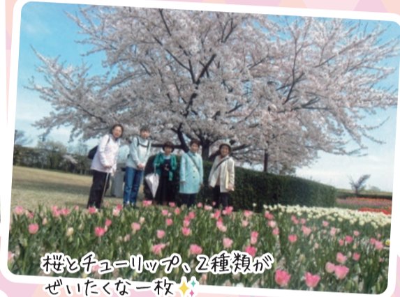
桜とチューリップ、2種類が ぜいたくな一枚 (元気塾様 4月13日 ふるさと村にて)