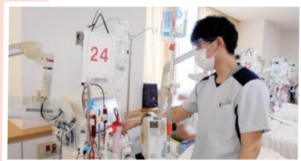
人工透析室で、透析患者さまの機器管理を行っています

植込み・電池交換手術対応、検査のための設定変更、ペースメーカー外来対応、遠隔モニタリングの管理