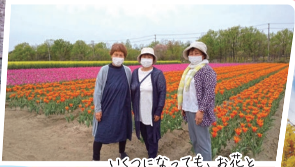
いつになっても、お花と 一緒に写りたい乙女心♥ (チューリップ娘3人組 様)