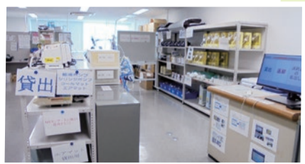
MEセンターでは、常に医療機器の状態に細心の注意を払っています