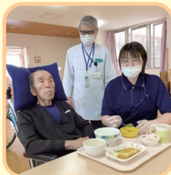
介護のプロが、一人ひとりに合わせたお食事を提供します