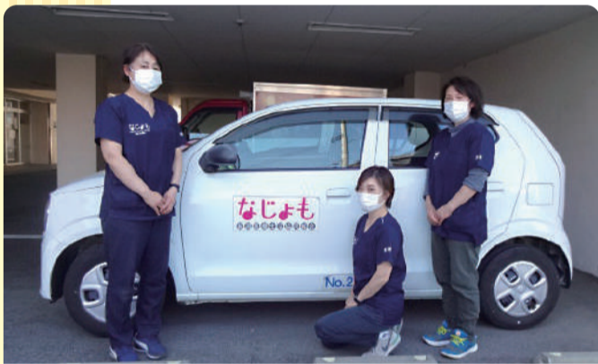
日中はこの車を相棒に、皆さまのお宅へ訪問しています(訪問看護ステーションなじよも スタッフ一同)