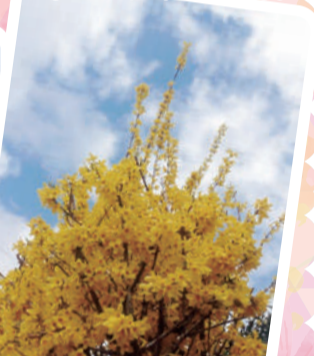
あの青空はとびきり〜!! (レンギョウ) (東中野山 高橋 武雄 様)