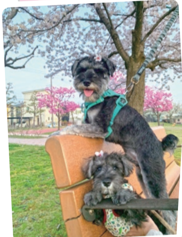
「キレイな桜だワン♪」 (もんちゃん、ふくちゃん)