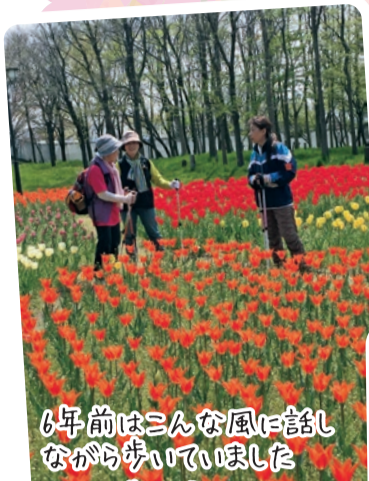
6年前はこんな風に話し ながら歩いていました

毎年恒例のお花見ウォークは、新型コロナ感染予防のため、お花見写真にて開催しました。素敵な組合員の皆さんの笑顔、今にも香って来そうなお花、そして澄み渡る青空はコロナ禍でも元気が湧いてきますね。お花見に行けなかった方もぜひ紙面でお楽しみください。 お写真のご協力、ありがとうございました。