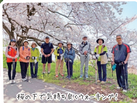
桜の下で気持ち良くウォーキング! (亀田郷土会「ノルディック・ウォーク」 クラブ sama-sama 様)