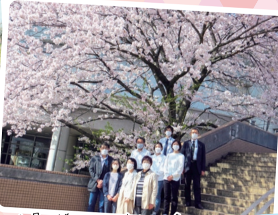
いつも組合員の皆さまに支えられ、多くの 活動ができていくことに感謝です (健康づくり委員会)