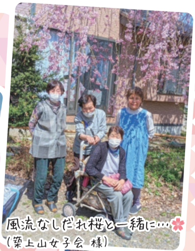
風流なしだれ桜と一緒に... (築上山女子会 様)