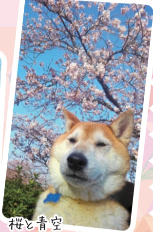
桜と青空 ワンコも満悦の表情! (ペンネーム おっさんド申文介 様)