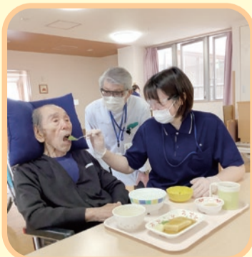
自分の口で食べることが、長生きの秘訣です

92歳の男性の方は、大動脈解離という大病を克服し、今年の3月に入所しました。食事は全介助で摂取されるものの、時々誤嚥(ごえん・食物が肺に入ってしまうこと)がありました。言語聴覚士の指導で食事の姿勢を調整し、その後は誤嚥が軽減、食欲が好転し本人の希望でお粥大盛としています。これからも努めて食べて長生きをしてもらいたいものです。